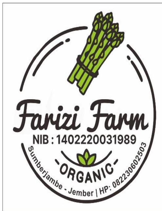
Gambar 2. Desain Logo