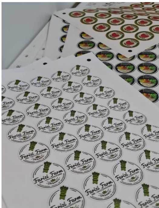
Gambar 3. Stiker