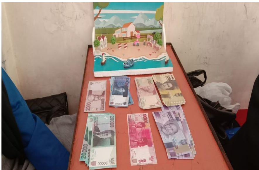
Gambar 1. Media dorama “ Si Daffa dan Uang Warna Warni”