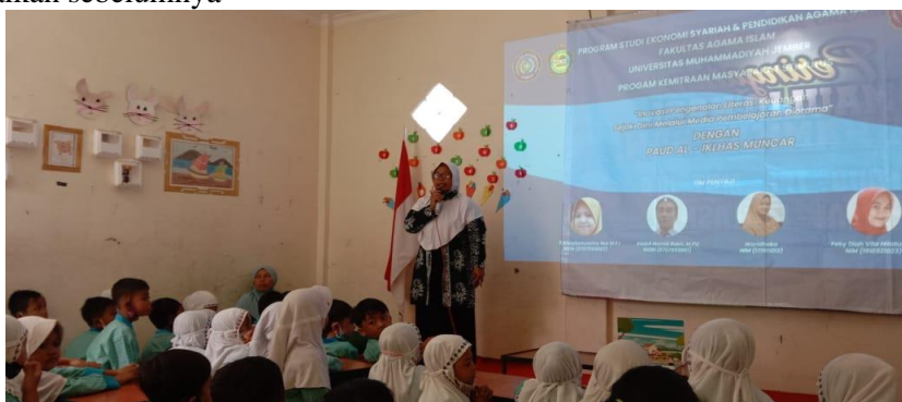
Gambar 3. Sambutan Pihak Sekolah Tentang Pentingnya Pendidikan Keuangan Sejak Dini

Pada tahapan pelaksanaan sesuai dengan jadwal yang telah disusun. Maka kegiatan diawali dengan sambutan dari pihak sekolah mengenai puncak kegiatan tematik pada tema profesi serta menjelaskan pentingnya pendidikan keuangan sejak dini bagi anak-anak. Anak-anak perlu memahami secara dasar mengenai profesi dan uang sebagai nilai hasil yang didapatkan dalam kegiatan profesi yang telah dikenalkan sebelumnya