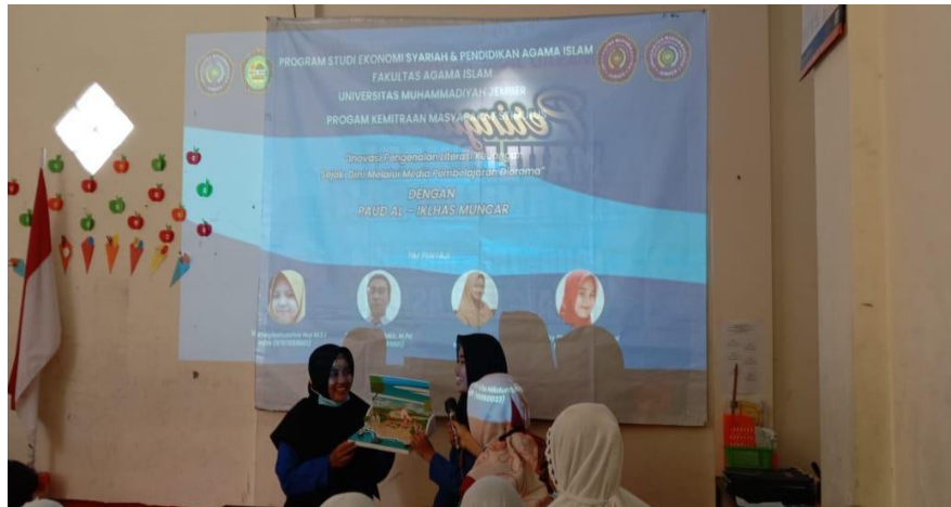
Gambar 4. Mahasiswa Mengenalkan Media Diorama Sesuai dengan Alur Cerita “Si Daffa dan Uang Warna Warni”

Untuk kegiatan selanjutnya, tim pelaksana mensosialisasikan materi Inovasi Pengenalan Literasi Keuangan Sejak Dini melalui Media Pembelajaran Diorama sebagai salah satu media unik dan inovatif dalam mengenalkan keuangan bagi anak-anak khususnya di tingkat usia dasar. Lalu dilanjutkan dengan dengan kegiatan pengenalan media diorama kepada anak-anak yang dilaksanakan oleh tim mahasiswa. Untuk membangkitkan semangat anak-anak dalam menerima materi, maka kegiatan ini diawali dengan game tepuk tangan yaitu tepuk semangat dan tepuk PAUD AL IKHLAS. setelah itu, barulah mahasiswa mulai bercerita dengan media diorama sesuai dengan judul diorama “ Si Daffa dan Uang Warna Warni”