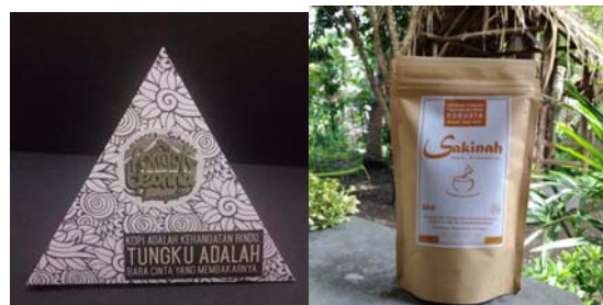
Gambar 5 : Perbandingan Kemasan Kopi Pondok Leonna dan Kopi Sakinah

Penelitian ini juga menyoroti perubahan bentuk pada kemasan produk dari limas dengan bahan dasar kertas Art Paper 220gr yang rumit dalam pengerjaan menjadi lebih praktis dan kekinian. Produk kopi Sakinah berusaha beradaptasi dengan trend produk jenis industri rumah tangga yang lebih simpel dan minimalis yaitu menggunakan kemasan standing pouch paper kraft yang mudah dibuka dan ditutup. Di bawah ini adalah transformasi bentuk kemasan Kopi Leonna menjadi Kopi Sakinah.