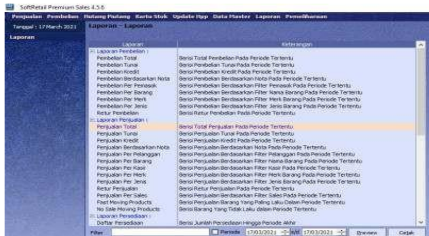
Gambar 5.5 Menu Laporan pada Bromosof