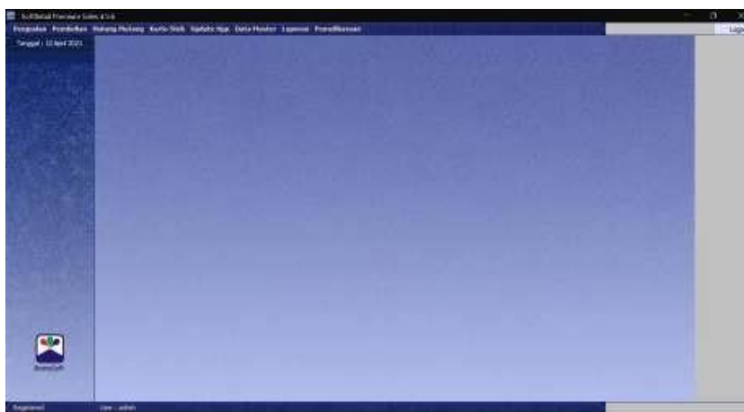
Gambar 5.1 Menu Bomsoft