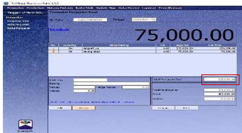
Gambar 5.3 Simulasi Penjualan