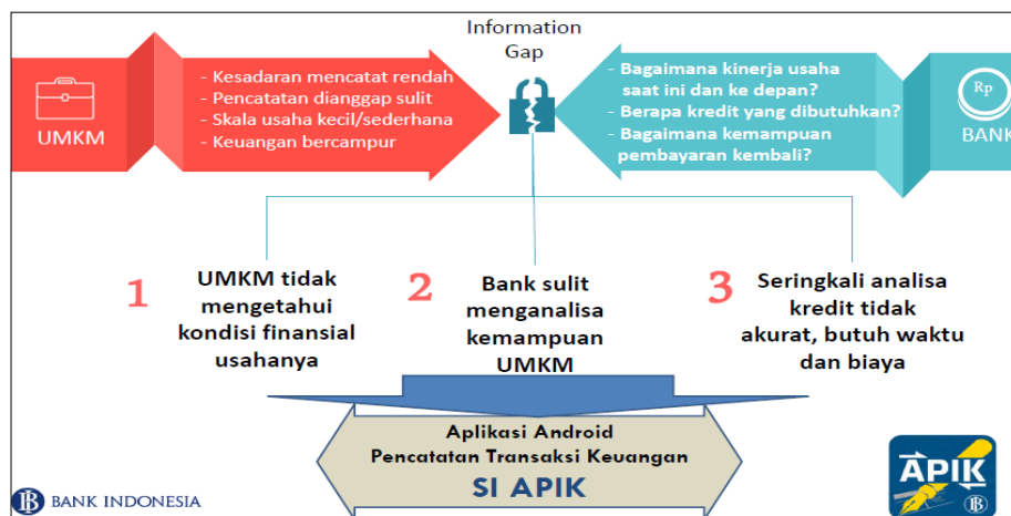
Gambar 2. Pentingnya Penggunaan SI APIK bagi Usaha Mikro

mengikuti PKM ini dan sebelumnya dilain kesempatan kami menemui Kepala Desa dengan mendiskusikan berbagai hal. Tahap kedua, pelaksanaan kegiatan yaitu pelatihan dan pendampingan literasi keuangan, Tersaji dalam Tabel berikut :