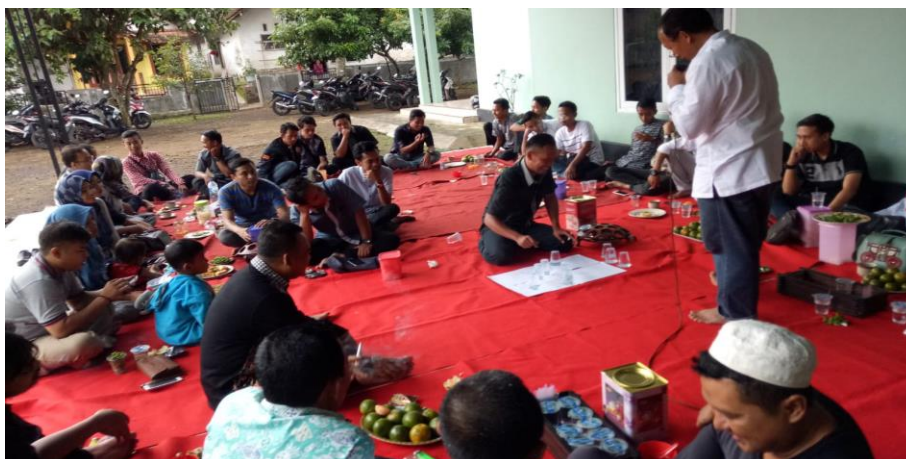
Gambar 5. Suasana Simulasi Pengambilan Keputusan Keuangan