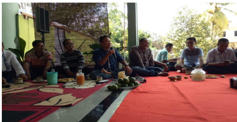
Gambar 6. Suasana Penyampaian Materi PKM

Mitra PKM juga diberitahu bahwa mereka tidak harus membuat seluruh laporan keuangan lengkap apabila tujuan pembuatan laporan keuangan hanya untuk kepentingan internal. Hal ini ditujukan untuk kemudahan dalam proses penyusunan laporan keuangan. Apabila hanya untuk kepentingan internal, disarankan minimal hanya membuat laporan laba rugi untuk tujuan pemantauan perkembangan kegiatan usaha. Namun, apabila mereka akan mengajukan pinjaman dana ke bank untuk tambahan modal usaha maka mereka disarankan minimal membuat laporan keuangan yang terdiri dari neraca dan laporan laba rugi.