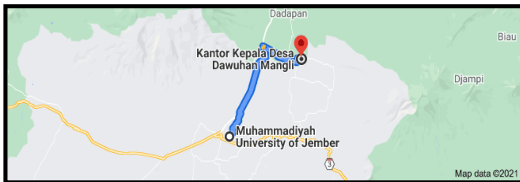
Gambar 1. Ilustrasi peta jarak dari UM Jember ke kantor Desa Dawuhan Mangli