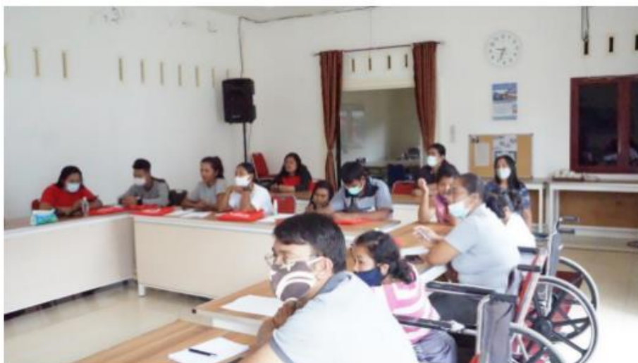
Gambar 1. Kegiatan Penyuluhan

Paparan pada kegiatan penyuluhan hemat energi juga merupakan pada kampanye penghematan energi pemerintah. Penghematan energi merupakan bagian kampanye nasional pemerintah, pada tahun 2015-2019 ada kampanye perubahan perilaku “ Potong 10% ” dimana hal ini idealnya dilakukan seluruh pihak/warga negara Indonesia yaitu dengan mengorganisasi perubahan perilaku di rumah, perkantoran, dan industri secara rutin untuk menginspirasi dan mengajak publik yang lebih luas sebagai best practice dalam gerakan perubahan di lingkungan kita masing-masing.