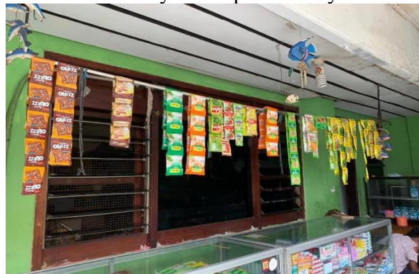
Gambar 4. Layout produk yang dijual