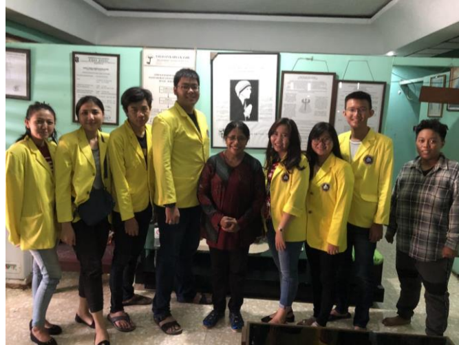
Gambar 1. Team Abdimas dengan Pendiri dan Pengurus Panti

bangunan 2 lantai dan sampai saat ini telah merawat 37 orang anak, yang terdiri mulai dari balita hingga remaja dan dirawat oleh 10 orang pengurus. Lokasi bangunan Panti Asuhan Karya Kasih sulit ditemukan oleh pengunjung, hal ini dikarenakan selain lokasi akses yang sulit, papan nama mereka juga sudah kusam sehingga tidak dapat dilihat dengan jelas. Kondisi sekitar lingkungan Panti cukup ramai karena berada di tengah pemukiman yang padat penduduk, selain itu anak-anak penghuni panti juga ramah pada pengunjung yang datang.