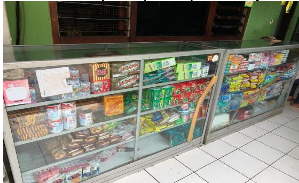
Gambar 3. Layout Koperasi Karya Kasih