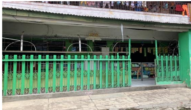
Gambar 2. Tampak depan Koperasi Karya Kasih

bagi pembeli dan mengakibatkan pembeli meragukan keamanan dari produk yang dijual. Melihat kondisi yang dialami oleh Panti Asuhan Karya Kasih tersebut maka program yang diajukan adalah melakukan beberapa pembenahan dari sisi pemasaran, penataan stok, maupun dari pemberian modal kerja berupa barang dagangan dan pendampingan pencatatan administrasi. Diharapkan dengan adanya program ini pihak Panti Asuhan Karya Kasih bisa mendapat pemasukan yang signifikan melalui tata kelola unit usaha yang jauh lebih baik dari sebelumnya.