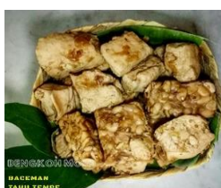
Gambar 1. Contoh Olahan Bengko Moleh

Kegiatan pendampingan awal yang dilakukan berupa koordinasi dengan lembaga kerjasama mengenai alur dan proses kegiatankajian halal yang akan dilakukan. Tim pengabdian selanjutnya melakukan sosialisasi penerapan sistem jaminan halal kepada pelakuUMKM melalui survey dan pemetaan lokasi pengabdian, serta menganalisis karakteristik masyarakat di lokasi tersebut. Setelah itu, tim pengabdian memberikan informasi kepada peserta UMKM yang terlibat untuk mengikuti serangkaian kegiatan. Tahapan terakhir, tim pengabdian melakukan tindak lanjut kepada peserta untuk memastikan kehadiran dalam acara pelatihan dengan mengunjungi langsung atau melalui media komunikasi.