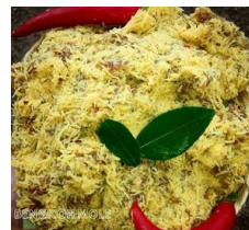
Gambar 1. Contoh Olahan Bengko Moleh