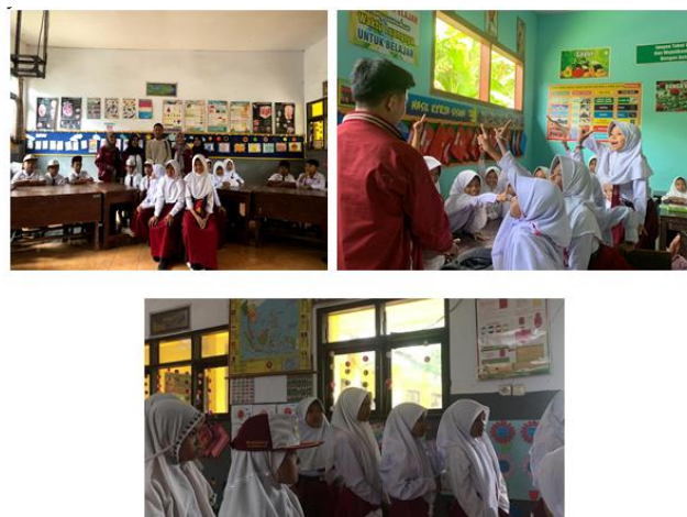
Gambar 2. Pelaksanaan sosialisasi PHBS dan praktik cuci tangan 6 langkah