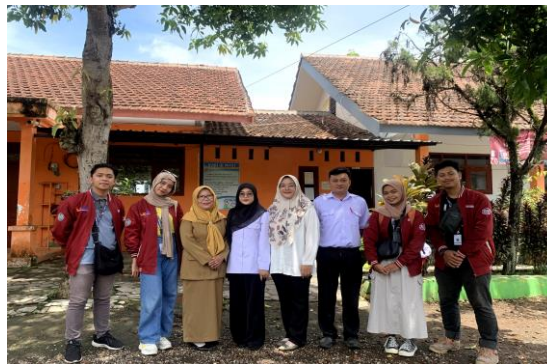
Gambar 3. Dokumentasi tim pendidik, dan mahasiswa KKN Universitas Muhammadiyah Jember