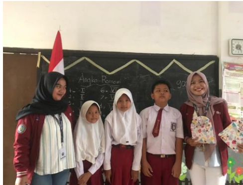
Gambar 3. Pemberian Apresiasi Kepada Siswa/siswi SDN Karangsono 04