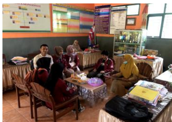
Gambar 1. Koordinasi, pendidik, dan mahasiswa KKN Universitas Muhammadiyah Jember

Evaluasi kegiatan pengabdian ini mencakup evaluasi penyuluhan dan evaluasi praktik. Mahasiswa KKN Universitas Muhammadiyah Jember memberikan penyuluhan tentang materi PHBS pada siswa-siswi SDN Karangsono 04, yang meliputi mencuci tangan dengan sabun dan air bersih, mengonsumsi makanan dan jajanan yang sehat, menggunakan jamban yang layak, rajin menyikat gigi setiap hari, pemberantasan jentik nyamuk, serta membuang sampah pada tempatnya. Setelah penyuluhan selesai, Mahasiswa KKN Universitas Muhammadiyah Jember memberikan beberapa pertanyaan kepada siswa-siswi SDN Karangsono 04 dimana bagi siswa/siswi yang dapat menjawab dengan benar maka akan diberikan hadiah sebagai bentuk apresiasi. Berdasarkan dari kegiatan yang sudah dilakukan, siswa-siswi SDN Karangsono 04 banyak berperan aktif dalam kegiatan ini, dibuktikan dengan 18 siswa dari kelas 2 (72%) dan 13 siswa dari kelas 3 (86,6%) yang aktif bertanya dan menjawab. Selain itu, siswa juga dapat mempraktikkan gerakan cuci tangan 6 langkah yang telah dicontohkan sebelumnya. Hal ini membuktikan bahwa penyuluhan dapat meningkatkan pengetahuan dan keterampilan siswa tentang PHBS dan cuci tangan.