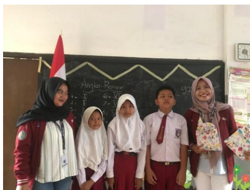
Gambar 3. Pemberian Apresiasi Kepada Siswa/siswi SDN Karangsono 04