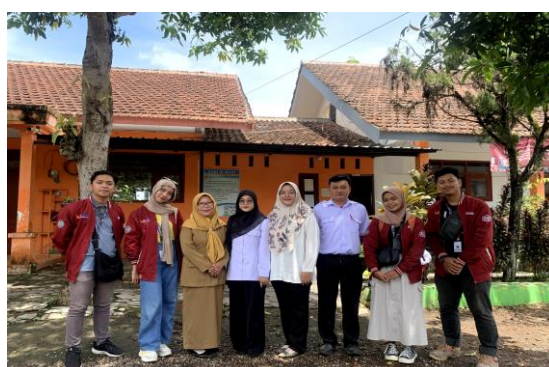
Gambar 3. Dokumentasi tim pendidik, dan mahasiswa KKN Universitas Muhammadiyah Jember