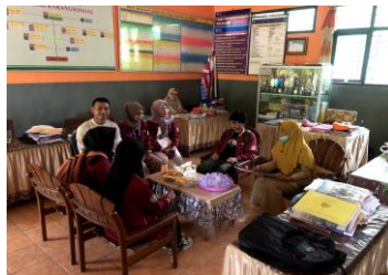
Gambar 1. Koordinasi, pendidik, dan mahasiswa KKN Universitas Muhammadiyah Jember

Evaluasi kegiatan pengabdian ini mencakup evaluasi penyuluhan dan evaluasi praktik. Mahasiswa KKN Universitas Muhammadiyah Jember memberikan penyuluhan tentang materi PHBS pada siswa-siswi SDN Karangsono 04, yang meliputi mencuci tangan dengan sabun dan air bersih, mengonsumsi makanan dan jajanan yang sehat, menggunakan jamban yang layak, rajin menyikat gigi setiap hari, pemberantasan jentik nyamuk, serta membuang sampah pada tempatnya. Setelah penyuluhan selesai, Mahasiswa KKN Universitas Muhammadiyah Jember memberikan beberapa pertanyaan kepada siswa-siswi SDN Karangsono 04 dimana bagi siswa/siswi yang dapat menjawab dengan benar maka akan diberikan hadiah sebagai bentuk apresiasi. Berdasarkan dari kegiatan yang sudah dilakukan, siswa-siswi SDN Karangsono 04 banyak berperan aktif dalam kegiatan ini, dibuktikan dengan 18 siswa dari kelas 2 (72%) dan 13 siswa dari kelas 3 (86,6%) yang aktif bertanya dan menjawab. Selain itu, siswa juga dapat mempraktikkan gerakan cuci tangan 6 langkah yang telah dicontohkan sebelumnya. Hal ini membuktikan bahwa penyuluhan dapat meningkatkan pengetahuan dan keterampilan siswa tentang PHBS dan cuci tangan.