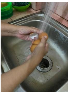
Gambar 1 Mencuci Cangkang Telur