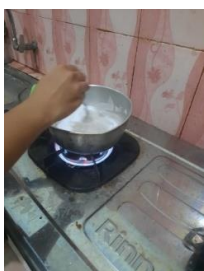
Gambar 5 : Mencampur dengan kanji