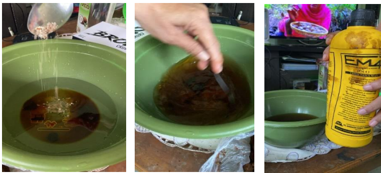
Gambar 10 : Mencampur dengan EM 4