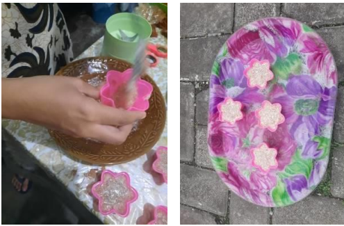
Gambar 7 : Adonan di jemur