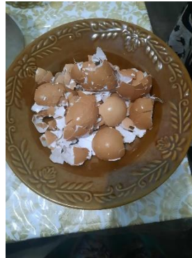
Gambar 1 : Cangkang Telur

Yang menjadi tujuan utama dari kegiatan Pengabdian Masyarakat ini adalah membantu masyarakat Desa Darsono, Kecamatan Arjasa, Kabupaten Jember untuk memanfaatkan cangkang telur yang banyak terdapat di peternakan ayam guna menambah meningkatkan perekonomian penduduk Desa Darsono.