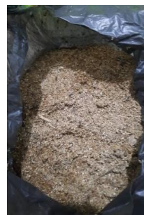
Gambar 4 : Serbuk Gergaji