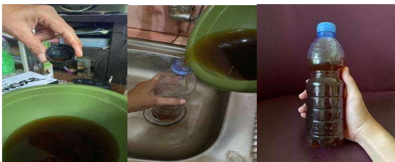
Gambar 11 : Cairan pupuk Cangkang Telur siap digunakan