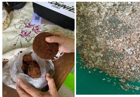
Gambar 9 : Mencampur cangkang telur, gula merah, air