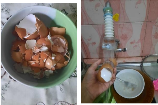
Gambar 8 : Mencuci cangkang telur