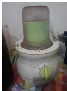
Gambar 2 Cangkang telur di blender