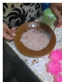
Gambar 6 : Adonan cangkang telur dicetak