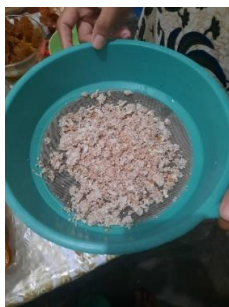
Gambar 3 : Cangkang telur halus