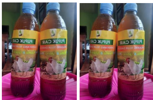
Gambar 12 : Cairan Pupuk Cangkang Telur Siap Dipasarkan