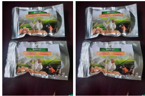
Gambar 8. Produk Jadi Briket