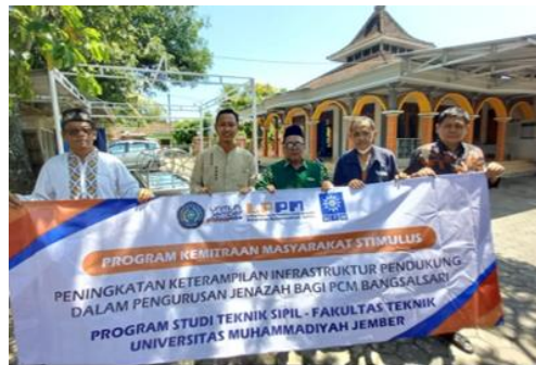
Gambar 8. Penyerahan Kegiatan Pengabdian secara simbolis kepada Mitra PCM Bangsalsari Jember

Dengan adanya tim ini maka setiap kegiatan yang akan dilaksanakan akan lebih transparan. Tim ini akan bertugas dalam mengelola setiap perubahan data dan mengelola kearsipan administrasi dari pihak masyarakat. Sehingga nantinya program ini akan terkelola dengan administrasi yang benar dan transparan. Apapun yang terjadi dalam proses pelaksanaan