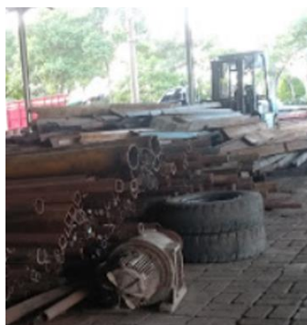
Gambar 2. pendampingan dalam pemilihan kualitas bahan besi dan stainless yang masih layak

Tahapan berikutnya yaitu melakukan pembentukan Tim Rukun Kifayah yang akan menjalankan program pengabdian ini. Tim Pelaksana melakukan pendampingan pengambilan data fisik lapangan bersama tim penyusun hingga data yang diperlukan bisa dicapai.