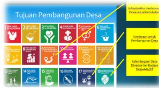
Gambar 7. Ketercapaian Program dari indikator SDG's