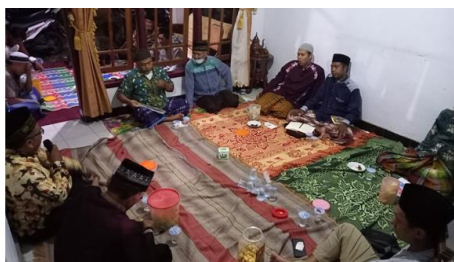
Gambar 1. Sosialisasi bersama Mitra

Pada tahap ini, akan diadakan sosialisasi tentang pemahaman dasar penyusunan Rukun Kifayah dan tahapan pemutakhiran data yang bisa dilakukan secara berkala. Selain itu akan dipaparkan pula tentang pemberdayaan SDM yang dimiliki mitra.