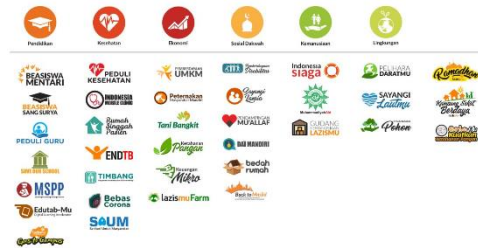
Gambar 4: Bentuk Penyaluran Dana LazisMu

Secara nasional, penyaluran dana oleh LazisMu fokus pada 6 pilar program pengembangan ekonomi dan sosial yang dapat dilihat pada gambar 4 yaitu pendidikan, kesehatan, ekonomi, sosial dakwah, kemanusiaan, dan lingkungan yang memiliki dampak besar pada keberlangsungan suatu peradaban. Keenam fokus penyaluran tersebut memiliki program khusus yang dirancang sesuai dengan kebutuhan masyarakat seperti terlihat pada gambar berikut: