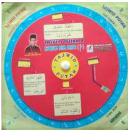
Gambar 2. Media Tajwid Putar untuk Hukum Mim Mati

Karton yang berbentuk lingkaran berdiameter 20 cm terlebih dahulu disusun 28 huruf hijaiyah untuk sisi yang paling luar dan hukum nun mati atau tanwin, yaitu: “ idzhar, ikhfaf, iqlab, idgham bigunnah dan idgham bilagunnah ” sesuai dengan 28 kolom dan untuk bagian muka kedua hukum mim mati, yaitu: “ ikhfafi syafawi, idzhar syafawi dan idgham mitslain ”. Bahan dilengkapi karton lapisan kedua berdiameter 18 cm, diberi tanda tunjuk ke salah satu huruf hijaiyah yang berhubungan dengan lubang yang menginformasikan