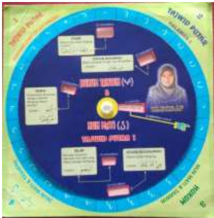
Gambar 1. Media Tajwid Putar untuk Hukum Nun Mati dan Tanwin