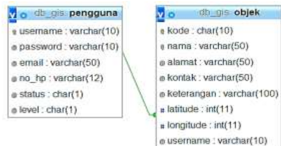
Gambar 1. Diagram kerelasian antar relasi desain db_gis1

Sesuai kebutuhan riil item data dalam aplikasi GIS, pemilihan jenis tipe data, ukuran, dan properti lainnya bisa berbeda dengan desain database di atas, tergantung pada DBMS yang digunakan atau detail kebutuhan penyimpanan data. Desain database tersebut jika ditampilkan dalam bentuk diagram kerelasian antar relasi tampak seperti Gambar 1.