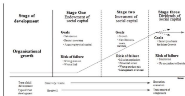
Gambar 2. Tahapan Perkembangan Kewirausahaan Sosial

Dalam buku yang berjudul “The Rise of The Social Entrepreneur” Leadbeater (1997) menjelaskan tahapan perkembangan kewirausahaan sosial yang digambarkan oleh gambar di bawah ini: