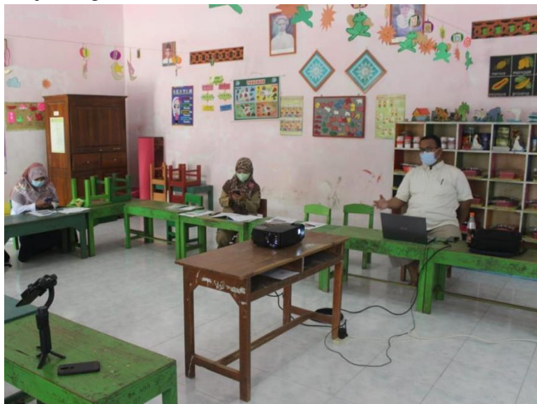
Gambar 2. Kegiatan pembekalan guru.

Kegiatan pendampingan produksi audio pembelajaran telah dilakukan selama 4 kali oleh mahasiswa KKN UMY Kelompok 13. Pengabdian berperan sebagai pembimbing semata dalam kegiatan tersebut. Kegiatan tersebut dimulai dari memperkenalkan cara melakukan produksi materi pembelajaran audio yang bisa juga menjadi materi acara radio edukasi. Setelah itu, peserta juga diperkenalkan dengan aplikasi Anchor yang dapat menyimpan, mengedit, dan memperdengarkan kembali materi audio. Penggunaan aplikasi tersebut menjadi alternatif mengingat sinyal radio yang menyiarkan materi pembelajaran yang telah diproduksi belum mencapai daerah Tlogolelo. Materi yang telah diproduksi tersebut diperdengarkan di Radio Edukasi yang dapat didengar oleh berbagai sekolah di sekitar radio. Media lain yang dapat digunakan yaitu untuk menyebarkan media yaitu Grup Whatsapp. Guru-guru sudah dapat memproduksi konten audio tetapi