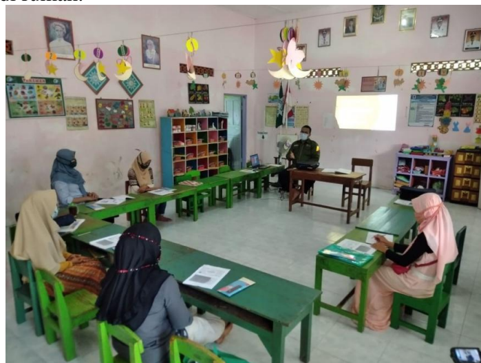
Gambar 1. Pembekalan bagi orang tua siswa

Kegiatan peningkatan kapasitas guru telah dilakukan pada dengan peserta guru TK ABA Tlogolelo yang berjumlah 5 orang yaitu 3 guru, 1 kepala sekolah, dan 1 karyawan.