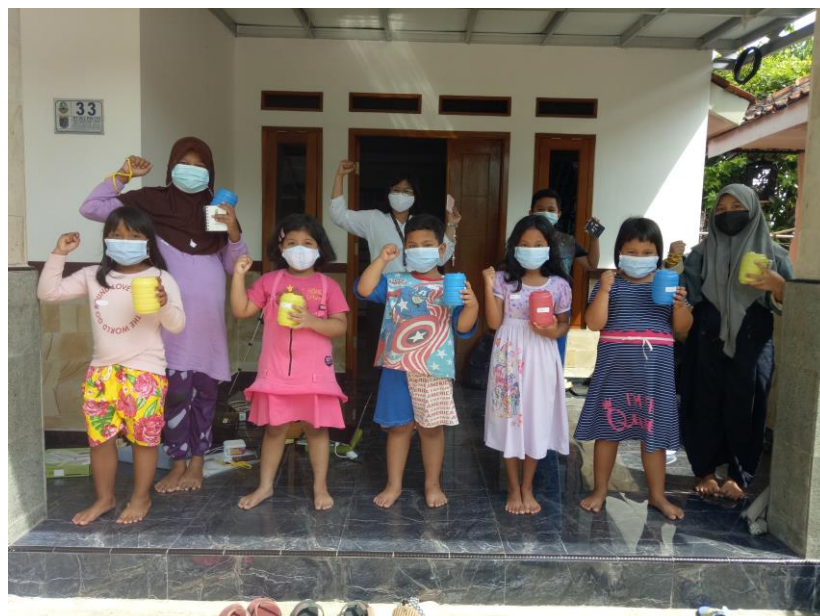
Gambar 3. Kegiatan Promosi Kesehatan secara Luring