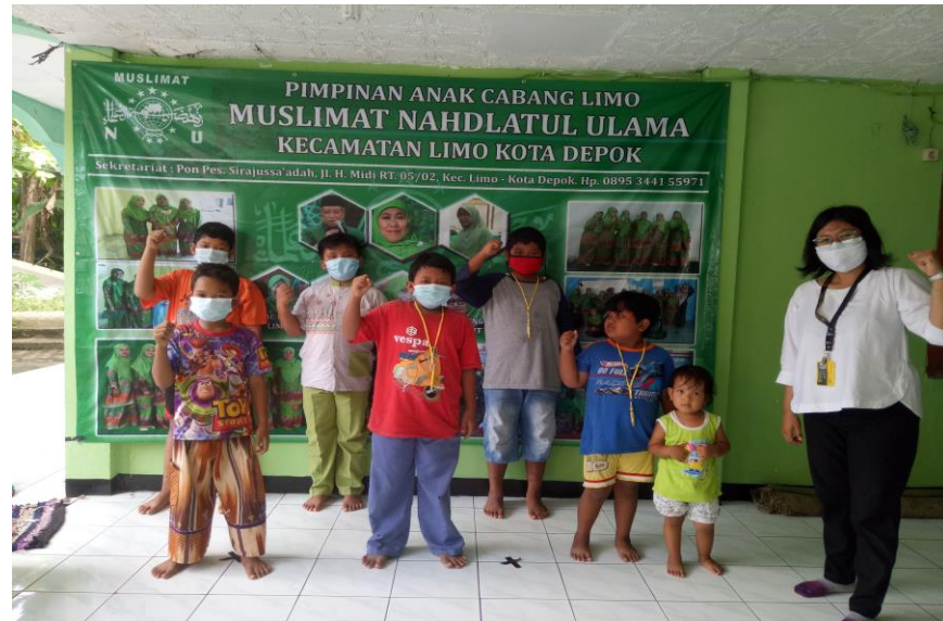
Gambar 4. Kegiatan Promosi Kesehatan secara Luring