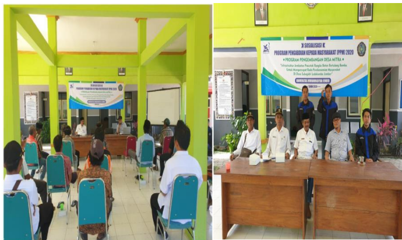
Gambar 3. Sosialisasi Dengan Kepala Desa, Tokoh Masyarakat dan Masyarakat (Mitra)

tugas-tugas anggota pengabdian. anggota bertugas: (1) Membantu ketua dalam pelaksanaan pengabdian, (2) Membantu ketua pelaksana dalam analisa kapasitas jembatan, (3) Membuat rencana analisa dampak pengabdian terhadap roda perekonomian masyarakat, (4) membantu menyusun manajemen pelaksanaan pengabdian. Mitra bertugas konsolidasi dengan anggota kelompok kreatif masyarakat dan tokoh-tokoh masyarakat. Mahasiswa bertugas: membantu ketua tim dalam menjalankan tugas pengabdian. Pada tanggal 29 Maret 2020 dilakukan sosialisasi