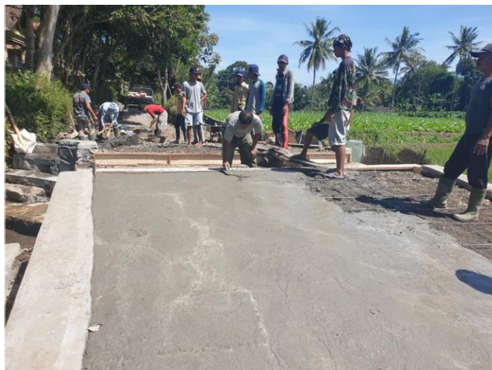
Gambar 5. Pengurugan Dan Pengecoran Beton K225 Sebagai Landasan Jalan

terjadi peluapan air saat hujan deras, mengingat lokasi merupakan titik terendah pada lokasi tersebut. Jembatan ditinggikan \pm 1,5 m dari dasar saluran. Pengecoran beton rabat K225 dilakukan untuk mencegah penurunan jalan tidak seragam akibat beban kendaraan dan tanah urug. Pemberian