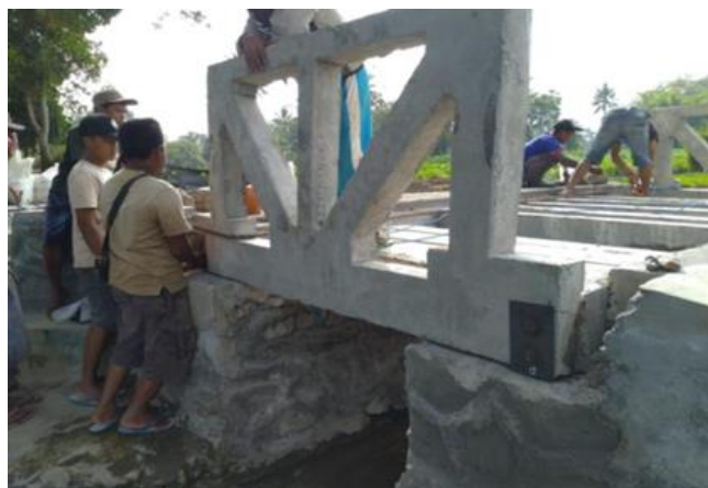
Gambar 6. Setting Balok dan Rangka Jembatan

Pada tanggal 25 Juli 2020 dilakukan pengurugan dan pengecoran beton K225 sebagai landasan jalan. Pengurugan sirtu dilakukan karena beda elevasi jalan asli dengan jalan rencana mencapai 1,4 meter. Elevasi jembatan ditinggikan dan lebar jembatan dinaikan dengan maksud