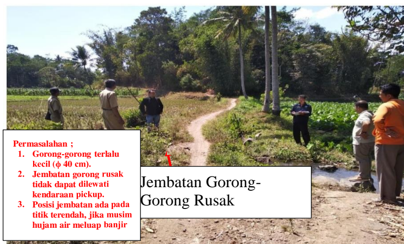
Gambar 1. Peta dan kondisi existing jembatan arah menuju RT.18