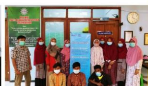
Gambar 15. Ruang Pojok Konseling Siap Digunakan