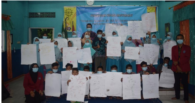
Gambar 6. Rancangan Goal Setting oleh Anak Panti Asuhan

Pada tahap selanjutnya anak-anak Panti Asuhan Aisyiyah Balongbendo diajarkan bagaimana mengubah keyakinan negatif menjadi keyakinan positif serta mengenal dan mengelola emosi. Dan pada akhir tahap, trainer mengajarkan cara membuat goal setting untuk kehidupannya masing-masing. Pada tahap ini mereka tampak bersemangat dalam merancang kehidupannya serta mempresentasikan hasil rancangan masa depannya didepan kelas sebagaimana tampak pada gambar 6.