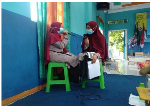
Gambar 11. Praktek Menjadi Konselor Sebaya Kelompok Putri

Pada sesi terakhir, anak-anak diajarkan mengenai teknik konseling sederhana sebagai bekal untuk melaksanakan konseling sebaya. Pada sesi akhir ini, mereka diminta untuk mempraktekkan menjadi seorang konselor sebaya, dan ternyata mereka menunjukkan kemampuannya sebagai konselor sebaya saat melakukan praktek di depan kelas sebagaimana yang terlihat di gambar 11 dan gambar 12.