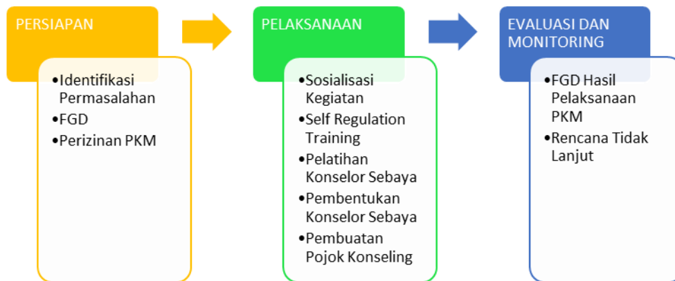
Gambar 1. Metode Pelaksanaan Pengabdian Masyarakat Di Panti Asuhan Yatim Aisyiyah Balongbendo

Secara lebih terperinci metode pelaksanaan dalam menyelesaikan persoalan yang dihadapi oleh anak Panti Asuhan Yatim Aisyiyah Balongbendo terdiri dari beberapa tahapan, antara lain: