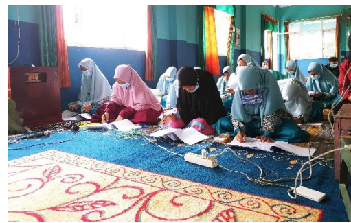
Gambar 3. Tahap Pre Test

Setelah anak-anak panti selesai mengisi pre test sebagaimana pada gambar 2, kemudian trainer yang terdiri dari 2 orang dengan dibantu oleh asisten trainer secara bergantian memberikan pembekalan mengenai tahapan-tahapan regulasi diri. Dimana pada tahap pertama mereka dikenalkan mengenai pemahaman akan potensi diri untuk membangun konsep diri positif. Pada tahap ini hasil yang didapatkan adalah bahwa konsep diri positif dalam diri mereka tumbuh kembali, yang sebelumnya tidak mau berbicara didepan rekan-rekannya mengenai kelebihan mereka, setelah kegiatan ini mereka berani untuk mengemukakan kelebihan yang mereka miliki serta menuliskannya di sebuah kertas untuk ditempel di dinding sebagaimana tampak pada gambar 4 dan gambar 5. Dalam penyampaiannya, pengabdian menggunakan berbagai model pembelajaran seperti bermain kartu, praktek serta diskusi sehingga tidak monoton dan membuat mereka sangat antusias. Hal ini dilakukan sebab model pembelajaran yang bervariasi, seperti menggunakan Flipbook-Based Electronic Textbooks dalam belajar akan membuat siswa termotivasi untuk belajar (Ratnasari & Hasanah, 2020).