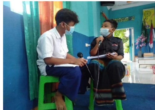
Gambar 22. Praktek Menjadi Konselor Sebaya Kelompok Putra

Pada sesi akhir sebelum penutupan, mereka diminta untuk membuat kelompok konselor serta membuat pojok konseling yang dipandu oleh Tim Abdimas Umsida dan Pengasuh. Adapun proses pembuatan pojok konseling hasil kreasi dari anak asuh tampak sebagaimana yang terlihat pada gambar 13, gambar 14 dan gambar 15.