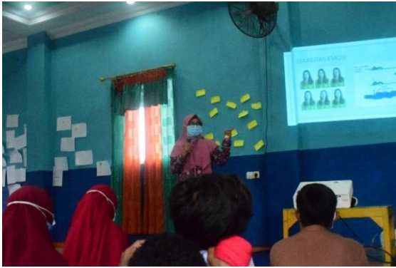
Gambar 9. Psikoedukasi Problematika Remaja