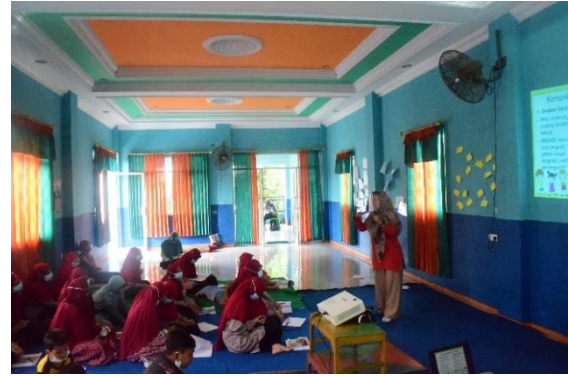
Gambar 10. Edukasi Teknik Konseling

Pada sesi terakhir, anak-anak diajarkan mengenai teknik konseling sederhana sebagai bekal untuk melaksanakan konseling sebaya. Pada sesi akhir ini, mereka diminta untuk mempraktekkan menjadi seorang konselor sebaya, dan ternyata mereka menunjukkan kemampuannya sebagai konselor sebaya saat melakukan praktek di depan kelas sebagaimana yang terlihat di gambar 11 dan gambar 12.