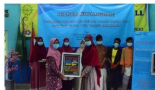
Gambar 12. Penyerahan Perlengkapan Pojok Konseling Oleh TIM Abdimas kepada Perwakilan Anak Pantu Asuhan