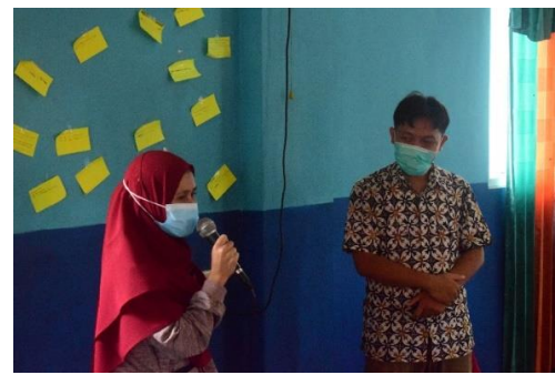
Gambar 5. Presentasi Kelebihan Dirinya