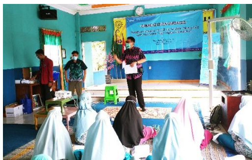
Gambar 2. Pengarahan Awal Sebelum Pelatihan Hari 1

Kegiatan self regulation training dilaksanakan pada tanggal 14 – 15 Desember 2020, selama 1 hari penuh mulai pukul 09.00 – 16.00 WIB. Anak-anak Panti Asuhan Yatim 'Aisyiyah yang terlibat dalam kegiatan ini sebanyak 25 anak asuh. Untuk rentang usia yang diikuti dalam kegiatan self regulation training ini adalah mereka yang sudah berada di jenjang kelas 5-6 SD serta jenjang SMP dan SMA. Pada kegiatan ini diawali dengan sesi perkenalan serta pengisian pre test mengenai kemampuan regulasi diri anak panti asuhan yang terlihat pada gambar 1.