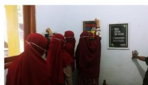
Gambar 14. Proses Menyiapkan Ruang Pojok Konseling Oleh Anak Asuh yang didampingi Tim Abdimas dan Pengasuh