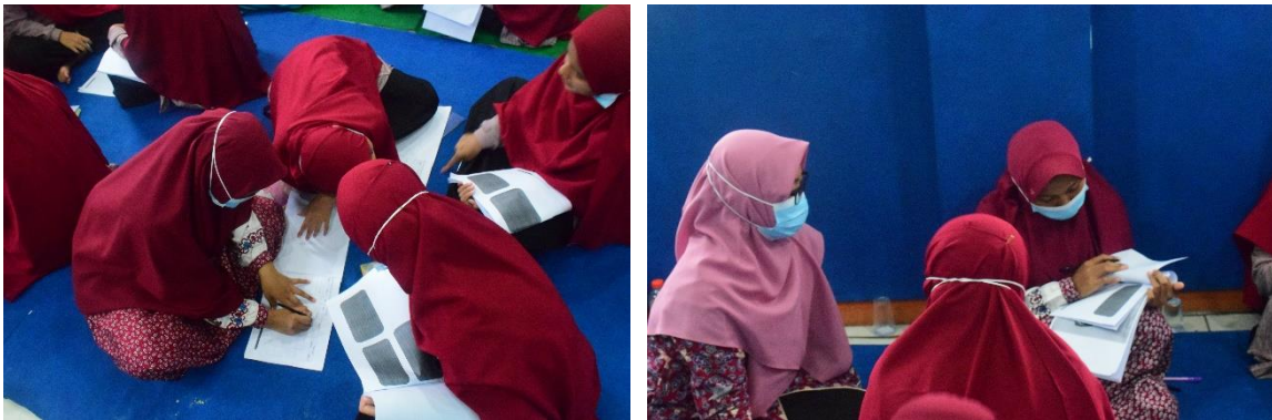
Gambar 7. Belajar Bermain Peran dalam Sesi Be Active Listener Gambar 8. Pendampingan Mengasah Empati Dalam Konseling

Pada tahap pertama anak-anak asuh diberikan pre test kembali untuk mengetahui kemampuan sebagai konselor sebaya. Setelah diberikan pre test, maka tahap selanjutnya diajarkan mengenai cara mendengar aktif atau active listener . Pada tahap ini, trainer tidak hanya memberikan ceramah saja, namun juga melakukan praktek secara berpasangan untuk menjadi pendengar yang baik saat salah satu teman-teman mereka bercerita didalam kelompok. Dalam 1 kelompok terdiri dari 3 orang, dimana mereka diminta untuk menjadi orang yang bercerita, orang yang mendengarkan dan observer. Pada kegiatan ini mereka tampak antusias sebagaimana terlihat pada gambar 7 dan gambar 8.