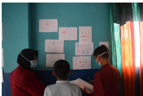
Gambar 4. Praktek Menuliskan Kelebihan

Setelah anak-anak panti selesai mengisi pre test sebagaimana pada gambar 2, kemudian trainer yang terdiri dari 2 orang dengan dibantu oleh asisten trainer secara bergantian memberikan pembekalan mengenai tahapan-tahapan regulasi diri. Dimana pada tahap pertama mereka dikenalkan mengenai pemahaman akan potensi diri untuk membangun konsep diri positif. Pada tahap ini hasil yang didapatkan adalah bahwa konsep diri positif dalam diri mereka tumbuh kembali, yang sebelumnya tidak mau berbicara didepan rekan-rekannya mengenai kelebihan mereka, setelah kegiatan ini mereka berani untuk mengemukakan kelebihan yang mereka miliki serta menuliskannya di sebuah kertas untuk ditempel di dinding sebagaimana tampak pada gambar 4 dan gambar 5. Dalam penyampaiannya, pengabdian menggunakan berbagai model pembelajaran seperti bermain kartu, praktek serta diskusi sehingga tidak monoton dan membuat mereka sangat antusias. Hal ini dilakukan sebab model pembelajaran yang bervariasi, seperti menggunakan Flipbook-Based Electronic Textbooks dalam belajar akan membuat siswa termotivasi untuk belajar (Ratnasari & Hasanah, 2020).