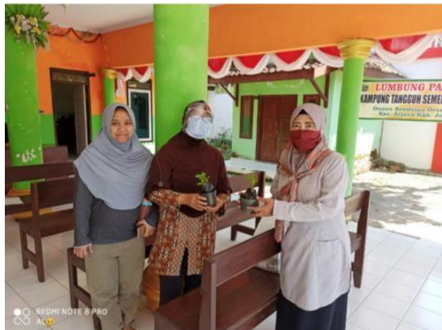
Gambar 2. Salah satu kegiatan observasi dan wawancara

Kolesom yang bernilai tinggi tidak bernilai diantara warga Arjasa dan sekitarnya, sehingga hal ini perlu diobservasi penyebabnya. Setelah melakukan wawancara dan observasi seperti pada Gambar 2 dan studi literatur dari laporan yang berjudul kecamatan Arjasa dalam angka tahun 2018 yang diterbitkan oleh badan pusat statistik kemudian dapat digambarkan dengan diagram fishbone penyebab kolesom tidak bernilai ekonomi di masyarakat desa Arjasa seperti pada Gambar 3.