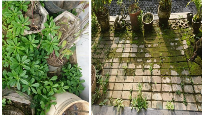
Gambar 1. kolesom tumbuh liar dihalaman rumah warga desa Arjasa

digunakan untuk sawah, tegal, kebun, bangunan halaman dan lain lain. Desa Arjasa merupakan desa dengan kepadatan penduduk terbesar kedua dari seluruh desa yang ada dikecamatan Arjasa yaitu sebesar 8.409 dengan kepadatan 1.601,71 jiwa/km 2 (Koordinator Statistik Kecamatan Arjasa, 2018). Masyarakat desa Arjasa sebagian besar bekerja sebagai petani. Kondisi di desa Arjasa masih memiliki lahan pertanian yang luas dan tanah yang subur serta air yang memadai sehingga tanaman mudah tumbuh subur di daerah Arjasa begitu juga dengan tumbuhan liar. Tumbuhan akan semakin subur dan rimbun pada musim penghujan seperti Gambar 1. Saat musim penghujan inilah tumbuhan kolesom Jawa semakin tumbuh subur di beberapa titik di lingkungan Arjasa, namun sayangnya penduduk di didesa Arjasa tidak banyak yang mengetahui manfaat dari tanaman tersebut sehingga hanya berakhir di pembuangan sampah. Hanya segelintir orang saja yang mengetahui manfaat tanaman tersebut.