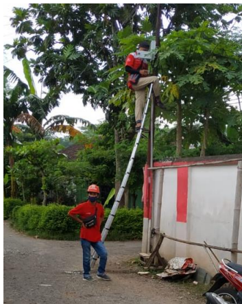
Gambar. 3. Proses pemasangan ISP

Setelah dibuat rancangan arsitektur jaringan selanjutnya adalah penentuan lokasi pemasangan jaringan RT-RW Net. Pada kegiatan PKM ini pemasangan (Fig.3 ) dilakukan di Jl. SMK Puger, Krajan I, Desa Kasiyan Timur, Kecamatan Puger, Kabupaten Jember, Jawa Timur. Untuk pemasangan jaringan internet ini menggunakan Internet Service Provider (ISP) Indihome milik PT Telkom Indonesia. Sebab hanya jaringan Telkom yang terjangkau untuk daerah Kasiyan Timur. Paket yang dipilih adalah paket internet dengan kecepatan 20 mbps yang dianggap sudah memenuhi kecukupan minimal ISP.