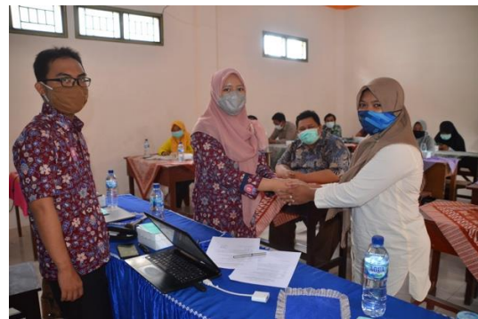
Gambar.6. Serah Terima PKM

Dalam pelaksanaan ISP, Tim pelaksana menemukan beberapa kendala. Kendala pertama yaitu Tim pelaksana kesulitan mendapatkan pelanggan perumahan atau pelanggan paket internet IT-Network. Hasil analisis Tim pelaksana adalah karena usaha yang Tim pelaksana dirikan ini masih merupakan usaha jenis baru dan kurang dikenal. Sehingga diperlukan upaya sosialisasi yang lebih gencar kepada warga Desa Kasiyan Timur, sehingga setidaknya usaha mulai didengar dan dikenal menjadi alternatif penyedia jasa internet murah. Kendala kedua sebagian besar warga desa Kasiyan Timur belum terbiasa dengan internet. Walaupun bagi remaja dan anak usia sekolah internet menjadi kebutuhan penopang kegiatan sekolah dari rumah, namun ternyata bagi usia di atas itu masih kesulitan untuk menggunakan internet dan mendapatkan manfaat dari internet. Hambatan ketiga adalah fasilitas infrastruktur ISP seperti tiang peletakkan kabel masih sangat terbatas sehingga untuk dapat memaksimalkan ISP atau lebih menyebarkan wilayah jangkauan ISP membutuhkan biaya yang lebih besar.