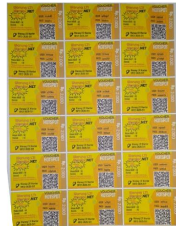
Gambar. 4. Voucher Internet

RT-RW Net dapat dinikmati oleh warga sekitar dengan cara pembelian voucher (Fig. 4). Voucher internet tersebut dititipkan kepada pedagang retail yang ada di sekitar wilayah dengan pemancar. Namun, voucher internet ini hanya untuk sekali pemakaian satu user dengan kecepatan maksimal tertentu, sehingga ketika sudah mencapai waktu pemakaian tertentu (Tabel 1), konsumen harus melakukan pembelian ulang voucher internet.