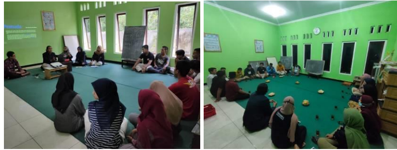
Gambar 6. Kegiatan Pendampingan

kegiatan pendampingan seperti yang terlihat pada Gambar 6.