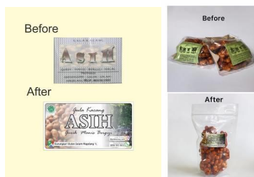
Gambar 2. Hasil Luaran Kegiatan Pelatihan Packaging dan Branding

Kegiatan ini bertujuan memberikan pengetahuan dan pengenalan Packaging dan Branding ini yaitu memperbaiki Packaging dan Branding sebelumnya agar menjadi lebih menarik dan dengan model yang baru agar lebih menarik konsumen. Hasil dari kegiatan ini adalah berupa luaran logo dan wadah pengemasan baru untuk UMKM Asih seperti yang terlihat pada Gambar 2.