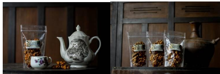
Gambar 4. Hasil Kegiatan Pelatihan Pengambilan Foto Produk

Kegiatan ini bertujuan memberikan pengetahuan dan keterampilan kepada pemilik dan karyawan UMKM Asih dapat mengambil foto produk yang akan digunakan sebagai bahan promosi di media sosial. Hasil pengambilan foto produk seperti yang terlihat pada Gambar 4.