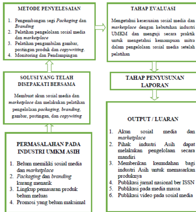
Gambar 1. Tahapan Pelaksanaan Pengabdian Kepada Masyarakat (PKM)