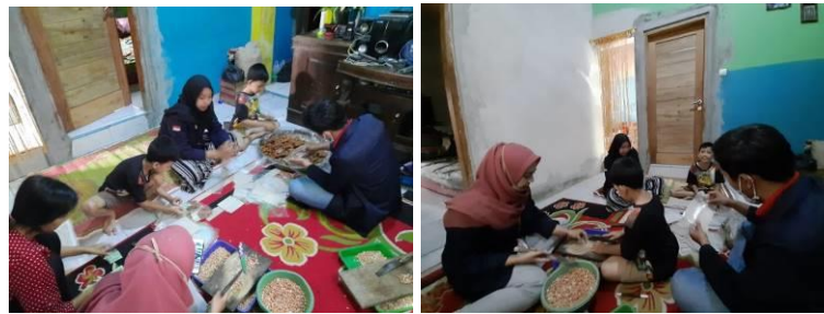
Gambar 3. Kegiatan Pelatihan Penggunaan Packaging Baru