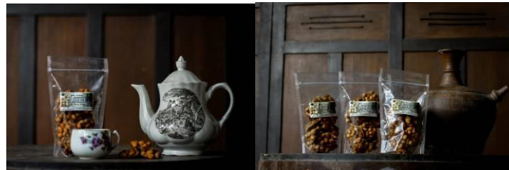
Gambar 4. Hasil Kegiatan Pelatihan Pengambilan Foto Produk

Kegiatan ini bertujuan memberikan pengetahuan dan keterampilan kepada pemilik dan karyawan UMKM Asih dapat mengambil foto produk yang akan digunakan sebagai bahan promosi di media sosial. Hasil pengambilan foto produk seperti yang terlihat pada Gambar 4.