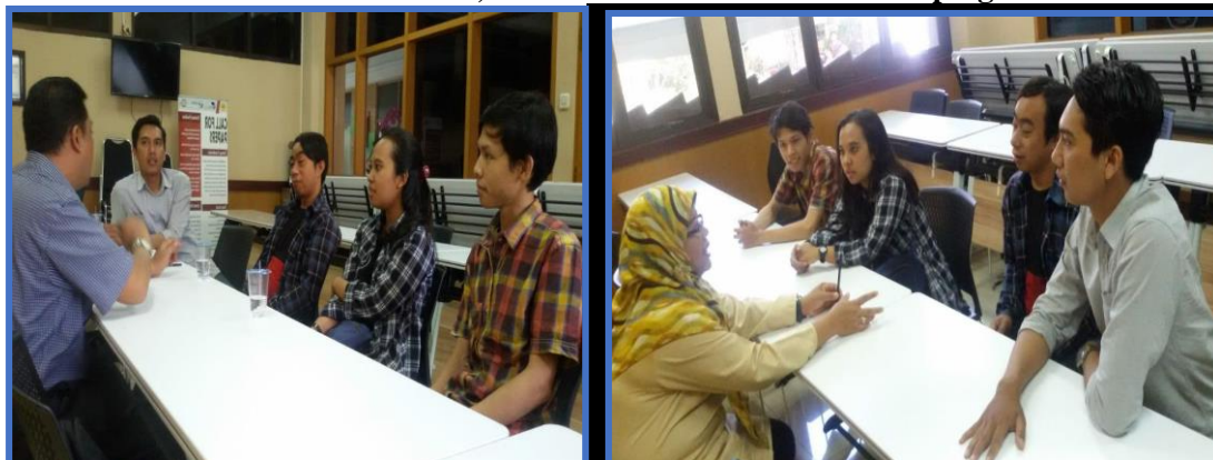
Gambar2. Pelatihan, Pendampingan Tentang Organisasi. Manajemen Dan Business Plan