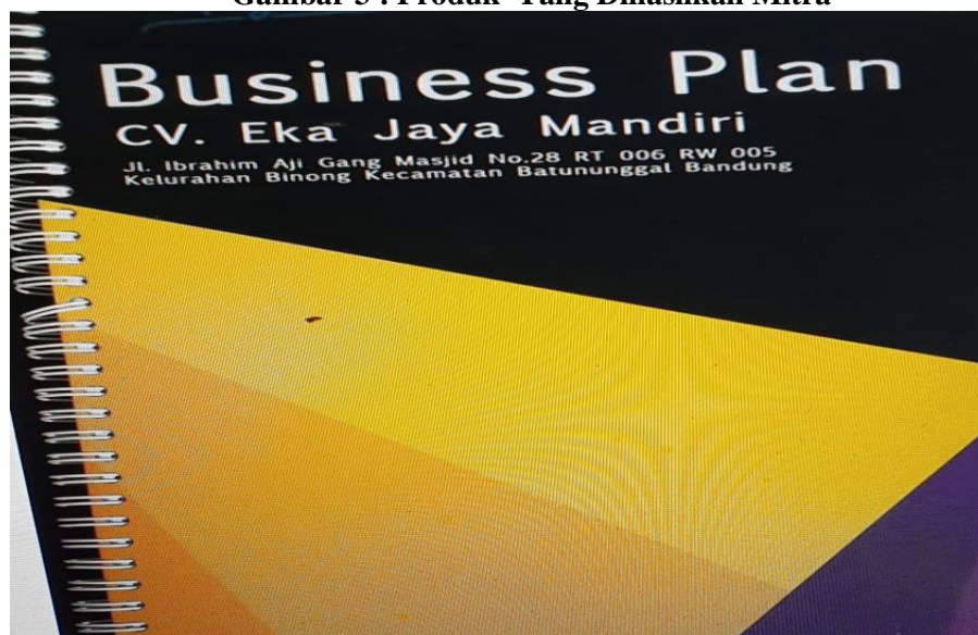
Gambar 4. Business Plan Bagi Mitra Yang Difasilitasi Tim