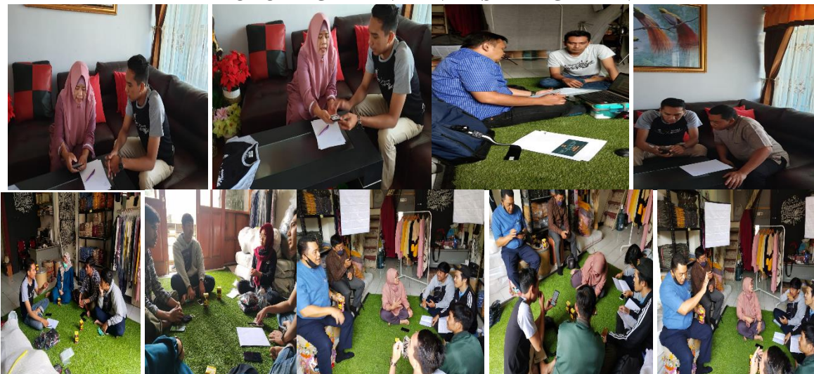
Gambar1: Koordinasi, Pelatihan. Bimtek Dan Pendampingan