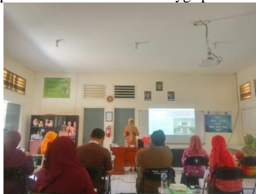
Gambar 1: Sosialisasi dan Pelatihan Manajemen Laboratorium Berbasis ISO 17025