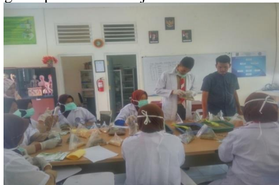
Gambar 3. Sosialisasi dan Pelatihan Pembuatan Metharizium

menginokulasikan jamur ke media pembawa yaitu beras jagung dengan alat seprot. Pelatihan ini disambut dengan antusias oleh siswa, guru di Jurusan Perkebunan maupun SMKN 4 Bondowoso karena pada akhir pelatihan diperoleh produk pengendali yang dikemas/dipacking dengan rapi dan bernilai jual.