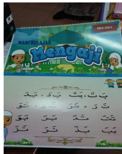
Gambar 2. Salah satu halaman pada alat peraga lembar balik Iqra jilid 2