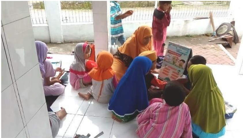
Gambar 3. Salah satu pendidik menggunakan alat peraga lembar balik Iqra' dalam pembelajaran

Berdasarkan hasil pelaksanaan program pengabdian kepada masyarakat ditemukan beberapa hal yang berhubungan dengan pemanfaatan media pembelajaran yang telah dirancang oleh tim pelaksana PKM yaitu: