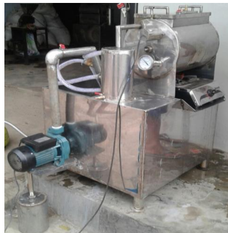
Gambar 1. Rancangan Struktural dan Unit Mesin Vacuum frying