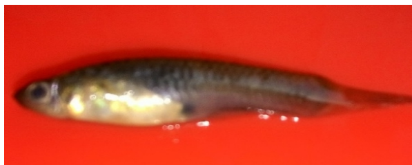
Gambar 3. Rasbora sp.

Ikan ini termasuk dalam familia Cyprinidae yang memiliki kepala menggepeng datar, mempunyai sepasang mata jernih, tubuh memanjang, bersisik tipis, terdapat garis kehitaman di bagian tengah badan, panjang sirip perut dalam satu garis horizontal, jari-jari sirip dada terluar tidak bercang, dan memiliki panjang sekitar 2-3 cm. Tubuh berwarna hitam keabu-abuan di bagian atas ( dorsalis ) dan putih keperakan di sisi dan bagian bawah, terutama di bagian perut. Sebuah garis keemasan di dalam, berjalan bersama garis kehitaman di bagian luar pada masing-masing sisi tubuh. Sirip punggung tidak berjari keras menulang.