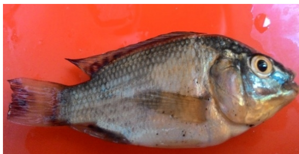
Gambar 1. Oreochromis sp.

Ikan ini termasuk dalam familia Cichlidae yang memiliki bentuk tubuh tidak terlalu besar dan panjangnya sekitar 10 cm. Memiliki sirip berpasangan, sirip punggung, sirip perut, sirip anus, dan sirip ekor. Letak mulut subterminal dan berbentuk meruncing. Warna tubuhnya yang hitam dan agak keputihan. Bagian bawah tutup insang berwarna putih. Sisik-sisik berukuran kecil dan kasar. Linea lateralis bagian atas memanjang mulai dari tutup insang hingga belakang sirip punggung sampai pangkal sirip ekor. Ukuran kepalanya relatif kecil dengan mulut berada di ujung kepala serta mempunyai mata yang besar.