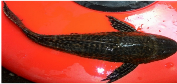
Gambar 6. Hypostomus sp.

Ikan sapu-sapu memiliki tubuh yang ditutupi oleh sisik keras kecuali pada bagian perutnya, bentuk tubuh pipih, kepala lebar, mulut terletak dibagian perutnya dan berbentuk cakram. Semua sirip kecuali sirip ekor selalu diawali dengan sirip keras. Sirip punggung lebar dengan 7 jari-jari lemah. Warna tubuh coklat dengan bintik-bintik hitam diseluruh tubuh.