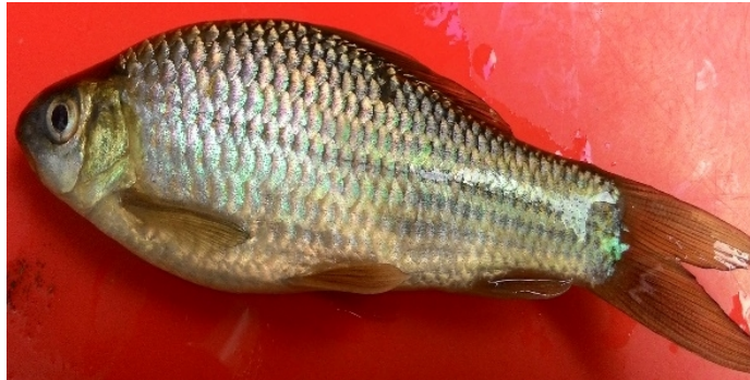
Gambar 2. Osteochilus sp.

Ikan ini termasuk dalam familia Cyprinidae yang memiliki bentuk tubuh tidak terlalu besar dan panjang sekitar 7 cm. Bentuk tubuh hampir serupa dengan ikan mas. Bedanya, pada bagian kepala lebih kecil. Pada sudut-sudut mulutnya, terdapat dua pasang sungut peraba. Warna tubuhnya hijau abu-abu. Sirip punggung memiliki 3 jari-jari keras dan 12-18 jari-jari lunak. Sirip ekor berbentuk cagak dan simetris. Sirip dubur disokong oleh 3 jari-jari keras dan 5 jari-jari lunak. Sirip perut disokong oleh 1 jari-jari keras dan 8 jari-jari lunak. Sirip dada terdiri dari 1 jari-jari keras dan 13-15 jari-jari lunak. Dekat sudut rahang atas ada 2 pasang sungut peraba.