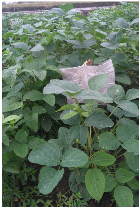
Gambar 3. Tanaman Kedelai Edamame dengan Pemberian Biofertilizer 75% (B3)

Menurut Uno (2001) dalam Masfufah, A (2012), bila suatu tanaman ditempatkan pada kondisi yang mendukung dengan unsur hara dan unsur mineral yang sesuai, maka tanaman tersebut akan mengalami pertumbuhan ke atas dan menjadi lebih tinggi. Pupuk biofertilizer yang digunakan pada penelitian ini terdiri atas beberapa mikroba yang terdiri atas: Bakteri pemfiksasi N ( Rhizobium sp. , Azotobacter sp. dan Azospirillum sp. ), bakteri pelarut fosfat ( Pseudomonas sp. , Lactobacillus. ) dan mikroba dekomposer ( Saccharomyces sp. , Cellulomonas sp. ).