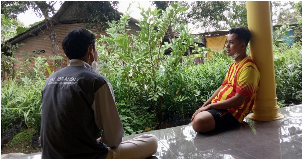
Gambar 2: Observasi dan Wawancara Dengan Pemilik Budidaya Jahe