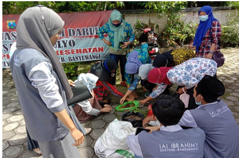
Gambar 4: Penanaman Jahe Oleh Ibu-ibu PKK

untuk kesehatan tubuh serta menambah imun tubuh manusia. Tanaman jahe merah merupakan salah satu tanaman yang bagus apabila dikonsumsi (Anonim, 2008:2).