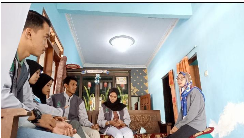
Gambar 1: Observasi dan Wawancara dengan Ibu-ibu PKK

Tahap pertama yang dilakukan adalah mensurvey warga serta mengomunikasikan terkait rencana penanaman tanaman toga dan kemudian mengadakan musyawarah sampai program ini bisa disepakati oleh warga Sarimulyo sehingga dapat membantu perekonomian warga setempat dengan menambah usaha, pengolahan, pemasaran produk penambah imunitas.