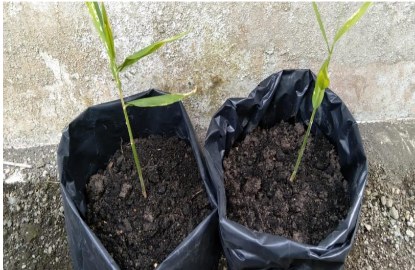
Gambar 5: bibit jahe setelah ditanam

Jika kita lihat pada gambar diatas terlihat baha jahe merah sudah mulai tumbuh dan ketika usinya sudah memenuhi untuk dipanen maka, jahe merah ini dapat diolah menjadi jamu tradisional. Tentunya dalam pembuatan jamu ini dilakukan oleh ibu-ibu PKK Desa Sarimulyo mereka sangat antusias sekali dalam kegiatan pembuatan jamu dari hasil jahe merah yang mereka tanam. Tentunya biaya yang dikeluarkanpun juga masih terjangkau.