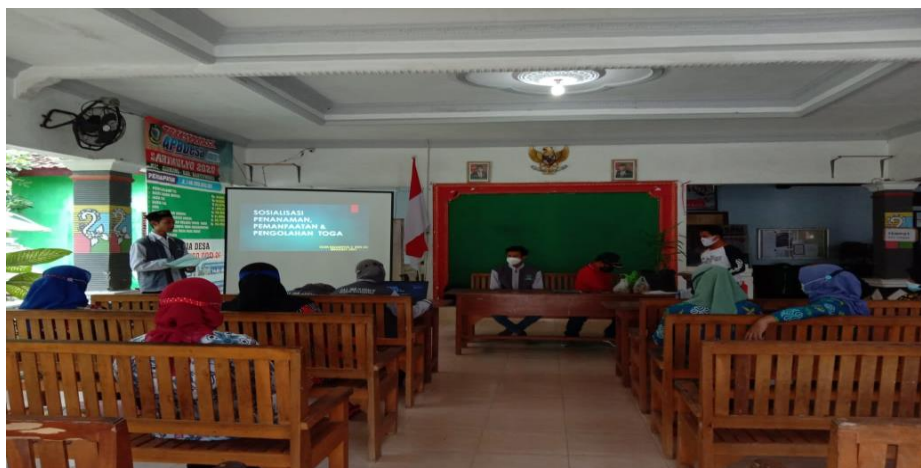
Gambar 3: Sosialisasi Pemberdayaan dan Pemanfaatan Tanaman Toga “jahe”

Dalam kegiatan penyuluhan serta pelatihan tanaman toga yang mana bisa untuk menambah imun tubuh, serta melibatkan warga desa Sarimulyo oleh ibuibu PKK. Adapun tema dari kegiatan ini adalah penanaman dan pengolahan tanaman toga untuk menambah imun, tentunya disini kami juga memberikan pendampingan cara pemasaran dan pemanfaatan tanaman toga “jahe”.