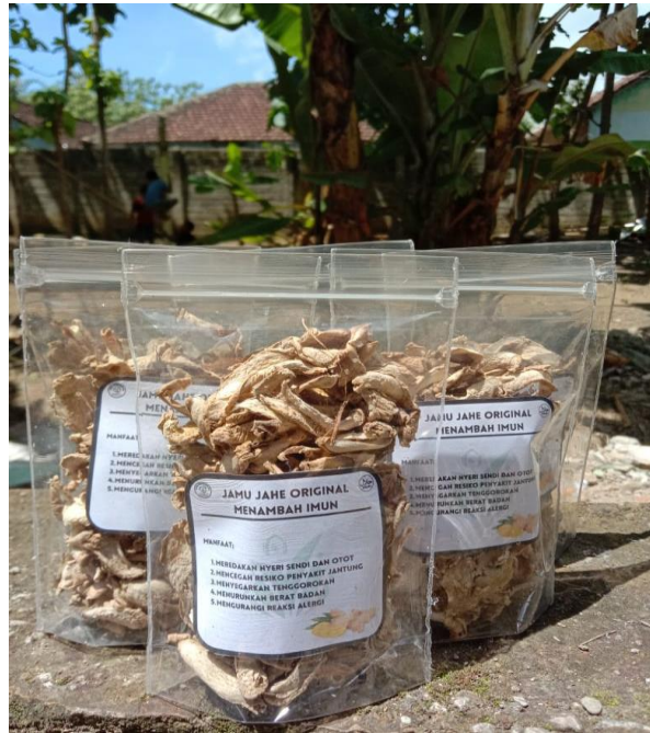
Gambar 6: produk jahe kering yang sudah dikemas