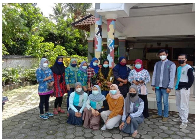
Gambar 7: foto bersama ibu-ibu PKK desa Sarimulyo

Dalam pelaksanaan kegiatan ini kami melaksanakan program pemanfaatan lahan kosong sebagai lahan pemberdayaan tanaman obat "JAHE" yang dilaksanakan pada tanggal 26 juli sampai 31 agustus 2021. Sosialisasi ini dihadiri oleh ibu-ibu PKK perwakilan dari masing-masing dusun Desa Sarimulyo yang berjumlah 8 orang.