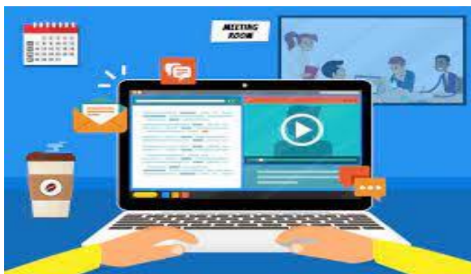
Gambar 2. Media Pembelajaran dalam Bentuk Digital

Pendampingan ini diharapkan akan mampu memberikan jalan alternatif bagi guru dalam mengembangkan metode pembelajarannya. Sebab pada era modern ini peserta didik lebih menyukai hal-hal yang bersifat instan dan mudah. Sehingga mau tidak mau guru harus berusaha keras menciptakan metode pembelajaran yang berbasis online. Oleh karena itu, melalui pelatihan pelatihan online learning ini, para ustad/ustadzah di Madrasah ini dapat menyampaikan materi secara lebih kreatif sehingga menjadi lebih mudah diterima oleh para santri milenial.