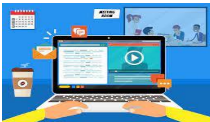
Gambar 2. Media Pembelajaran dalam Bentuk Digital

Pendampingan ini diharapkan akan mampu memberikan jalan alternatif bagi guru dalam mengembangkan metode pembelajarannya. Sebab pada era modern ini peserta didik lebih menyukai hal-hal yang bersifat instan dan mudah. Sehingga mau tidak mau guru harus berusaha keras menciptakan metode pembelajaran yang berbasis online. Oleh karena itu, melalui pelatihan pelatihan online learning ini, para ustad/ustadzah di Madrasah ini dapat menyampaikan materi secara lebih kreatif sehingga menjadi lebih mudah diterima oleh para santri milenial.