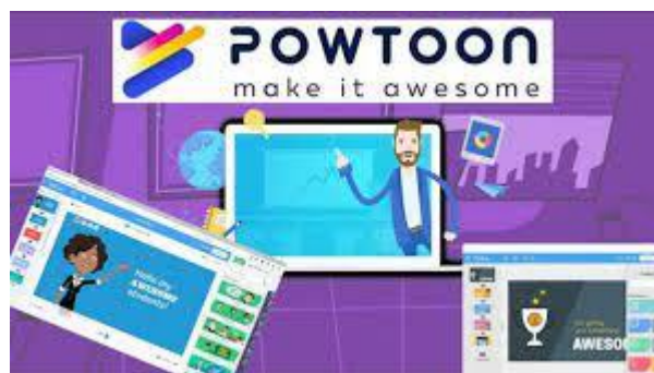
Gambar 3. Media pembelajaran dalam bentuk animasi

Teknologi yang akan kami perkenalkan diantaranya literasi digital, yaitu diantaranya adalah: membuat konten pembelajaran digital berbasis animasi dengan Powtoon , Quiz Online dengan Kahoot dan Quizizz , e-learning management system dengan moodle dan google class room , serta online meeting dengan Big Blue Button dan Google Hangout , yang dapat dilihat pada gambar dibawah ini.