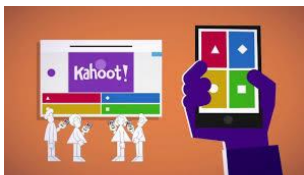
Gambar 4. Model Evaluasi Pembelajaran dengan Kuis Interaktif

Dengan adanya pelatihan online learning , manfaat yang diharapkan di antaranya adalah: