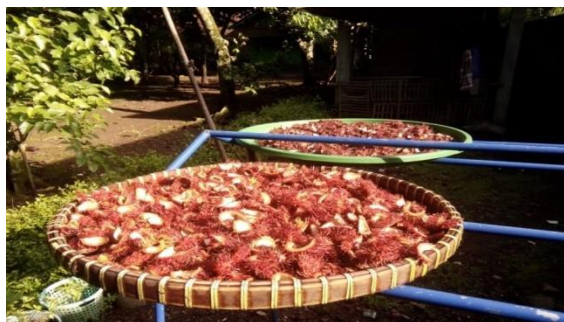
Gambar 3. Proses Penjemuran Kulit Rambutan