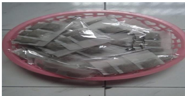
Gambar 4. Proses Pengemasan Teh Kulit Rambutan