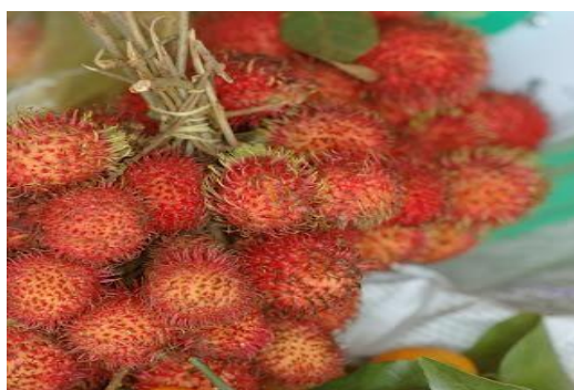
Gambar 2. Buah rambutan segar dan siap diolah

rambutan mengandung gizi yang cukup lengkap. Mulai dari karbohidrat, protein, lemak, fosfor, besi, kalsium, sampai vitamin C. Daging buah rambutan banyak mengandung sari buah, dapat dibuat makanan kaleng atau diolah menjadi selai, namun cita rasanya akan hilang. Selain itu daging buah rambutan dapat diolah menjadi berbagai macam olahan, contohnya : manisan rambutan, sirup rambutan, selai rambutan, dan makanan atau minuman lainnya. Kulit buah mengandung tanin dan saponin. Biji mengandung lemak dan polifenol. Daun mengandung Tannin dan Saponin . Kulit batang mengandung Tannin , Saponin , Flavonida , Pectic Substance , dan zat besi. Oleh karena itu, buah rambutan potensial dikembangkan sebagai tanaman keluarga yang dapat berfungsi sebagai makanan dan obat.