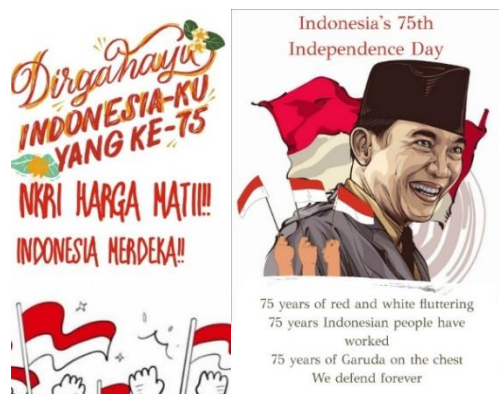
Gambar 3 Contoh Hasil Desain Siswa SMK Mahardika Karangploso Menggunakan Canva

Pada saat pemaparan materi, pemateri menanyakan secara langsung kepada peserta tentang pengetahuan awal aplikasi Canva. Dan hampir seluruh peserta menjawab belum pernah mengetahui sebelumnya. Oleh karena itu, peserta pelatihan sangat antusias mendengarkan dan langsung mempraktekkan aplikasi Canva. Menurut Tanjung & Faiza (2019) kelebihan Canva ketika digunakan sebagai media dalam pembelajaran yaitu: memiliki baragam desain grafis, animasi, template, dan nomor halaman yang menarik, meningkatkan kreativitas dan menghemat waktu baik guru maupun siswa dalam mendesain media untuk bahan presentasi baik berupa slide, mind mapping, poster. karena banyak fitur yang telah disediakan, serta memuat fitur drag dan drop sehingga siswa lebih mudah mengaplikasikannya, dapat melakukan kolaborasi dalam mendesain sehingga siswa dapat mengerjakan tugasnya sesuai dengan kelompok masing-masing, aplikasi Canva tidak hanya dapat dibuka di laptop tetapi juga dapat menggunakan ponsel.