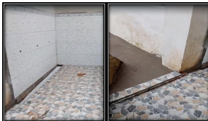
Gambar 5. Tempat wudhu di MusholaJabal Nur

Pelaksanaan kegiatan pengabdian ini, juga memfasilitasi usulan warga setempat untuk pembuatan papan nama sebagai identitas mushola. Pembuatan papan nama muhsola menggunakan bahan baku plat dan besi agar daya tahan papan nama awet. Dokumentasi kegiatan, dapat disajikan sebagai berikut.