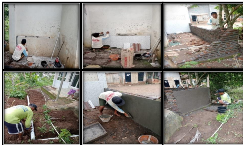
Gambar 4. Tahapan Proses Pembuatan Tempat Wudhu

Proses pembangunan tempat wudhu, dan beberapa sarana lainnya, dikerjakan dalam kurun waktu 5 hari, namun dengan durasi waktu selama 2 minggu. Hal ini dikarenakan dalam proses pembuatan tempat wudhu, musim hujan telah tiba sehingga akses untuk menuju kesana sangat sulit apabila bertepatan dengan datangnya hujan. Berdasarkan tahapan tersebut berikut, dokumentasi kegiatan.