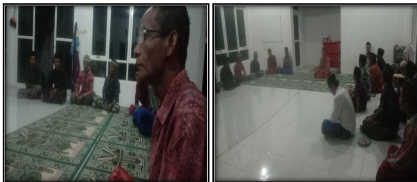
Gambar 2. Foto Kegiatan Musrenbang Kapasitas Mushola sebagai Pusat Kegiatan