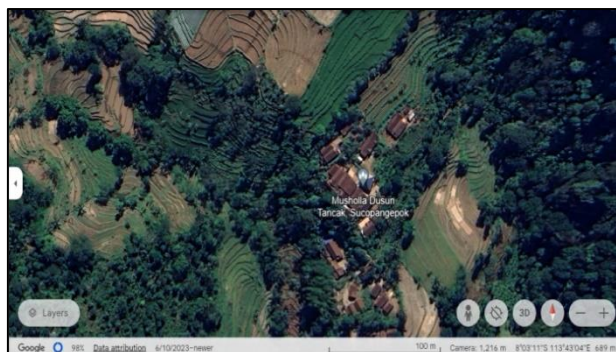
Gambar 3. Lokasi MusholaTempat Pelaksanaan Kegiatan Pengabdian