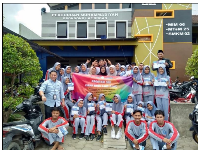
Gambar 5. Dokumentasi Kegiatan Sinau Bisnis Rame-Rame

Kegiatan ini diakhiri dengan pemberian kuesioner untuk evaluasi akan keberhasilan kegiatan ini. Berdasarkan Gambar 4 Hasil menunjukkan bahwa terdapat peningkatan hasil setelah dilaksanakan pengabdian ini yaitu rata-rata persentase meningkat pada titik 80 persen keatas yang didasarkan pada indikator yang telah ditentukan.