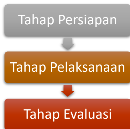
Gambar 1. Tahapan pelaksanaan Pengabdian kepada Masyarakat

Metode pelaksanaan dalam kegiatan pengabdian kepada Masyarakat ini dilakukan dalam tiga tahapan penting yaitu tahap persiapan, tahapan pelaksanaan kegiatan serta tahapan evaluasi . Gambar 1 menjelaskan tentang tahapan pelaksanaan Pengabdian kepada Masyarakat: