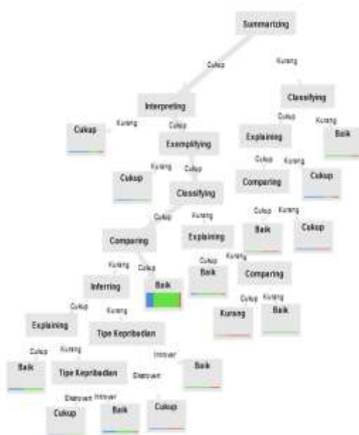
Gambar 3.3 Decision tree

Knowledge presentation yang didapatkan dari perhitungan algoritma C4.5 dapat dipresentasikan dalam dua bentuk, yaitu dalam bentuk pohon keputusan dan rule IF-THEN . Pohon keputusan yang dibentuk oleh Rapidminer dapat dilihat pada gambar 3.3.