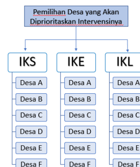
Gambar 2. Struktur Hirarki Pemilihan Prioritas Desa

Dari ketiga kriteria dan enam alternatif tersebut selanjutnya akan dibuat struktur hirarki dalam menentukan prioritas desa dapat dilihat at pada gambar berikut :