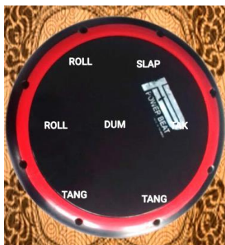
Gambar 3. Alat Musik Darbuka

Sedangkan bila tombol Darbuka di klick makan akan ditampilkan halaman yang akan di tampilkan alat music darbuka. Pada gambar darbuka di tengah-tengahnya ada tulisan menu, yang bila di tekan/ di klick tulisan tersebut akan mengeluarkan bunyi seperti bunyi alat music darbuka ketika di mainkan.