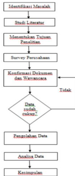
Gambar 2. Diagram Alur Penelitian (Jelvino dan Andry, 2017)

penelitian yang dilakukan, dapat dilihat dari gambar 2. Diagram Alur Penelitian.