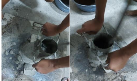
Gambar 6 Uji Slump

segar.4. Hasil uji slump digunakan untuk mengendalikan konsistensi beton sesuai dengan spesifikasi proyek yang dimana nilai dari pengujian ini sangat penting untuk sampel benda uji tersebut.