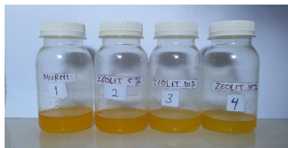
Gambar 3. Sempel bahan bakar

warnanya pun berubah semakin kuat. Bahan bakar plastik PET murni, atau yang ditambahkan zeolit alami, memiliki bau yang sangat menyengat. Proses pirolisis sampah plastik PET mempunyai interval waktu yang berbeda-beda, dan semakin banyak zeolit alam yang ditambahkan maka semakin cepat pula proses pirolisisnya. Dengan menambahkan katalis zeolit alam, waktu pirolisis menjadi lebih efektif. Umumnya warna bahan bakar resin PET cenderung kuning hingga jingga, namun bila ditambahkan katalis zeolit alam dalam jumlah besar, warnanya dapat berubah menjadi warna kehijauan seperti pada bahan bakar partalit, seperti terlihat pada Gambar 3.