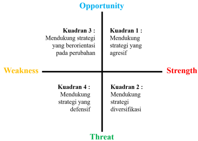
Gambar 1. Diagram Matriks SWOT