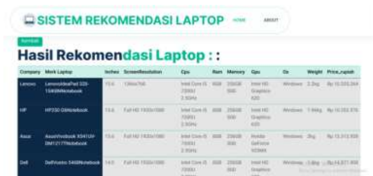
Gambar 5. Tampilan hasil rekomendasi berdasarkan spesifikasi

Menampilkan hasil pencarian atau rekomendasi berdasarkan kriteria yang dimasukkan pengguna.