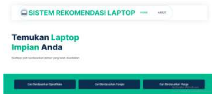
Gambar 3. Tampilan halaman website

Menyediakan menu navigasi untuk memudahkan pengguna menemukan fitur sesuai kebutuhan, seperti mencari laptop berdasarkan spesifikasi laptop, fungsi laptop, dan harga laptop.