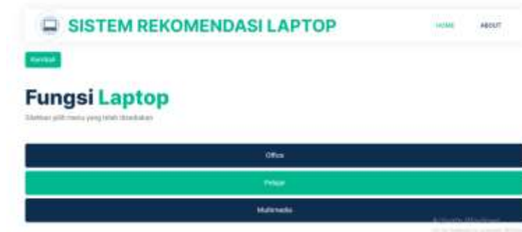
Gambar 6. Tampilan fungsi Laptop