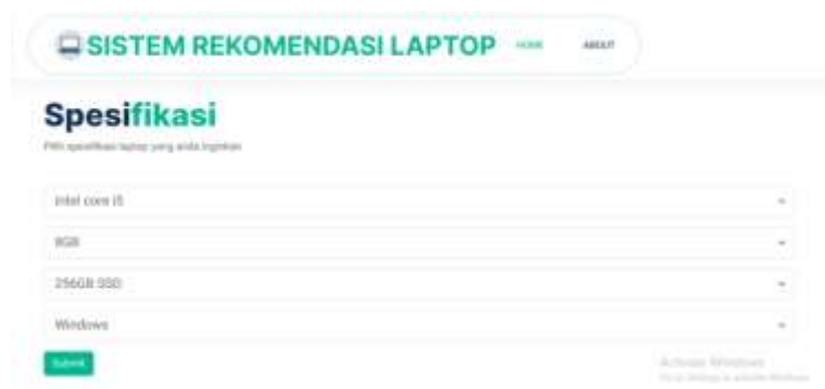
Gambar 4. Tampilan halaman spesifikasi

Menampilkan formulir pencarian yang memungkinkan konsumen untuk memasukkan kriteria atau kata kunci untuk mencari rekomendasi.