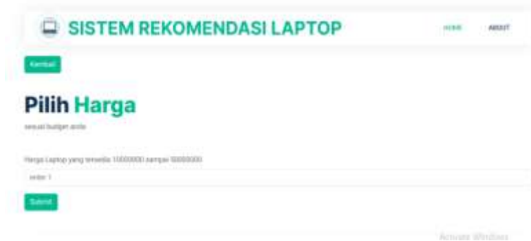
Gambar 7. Tampilan harga laptop