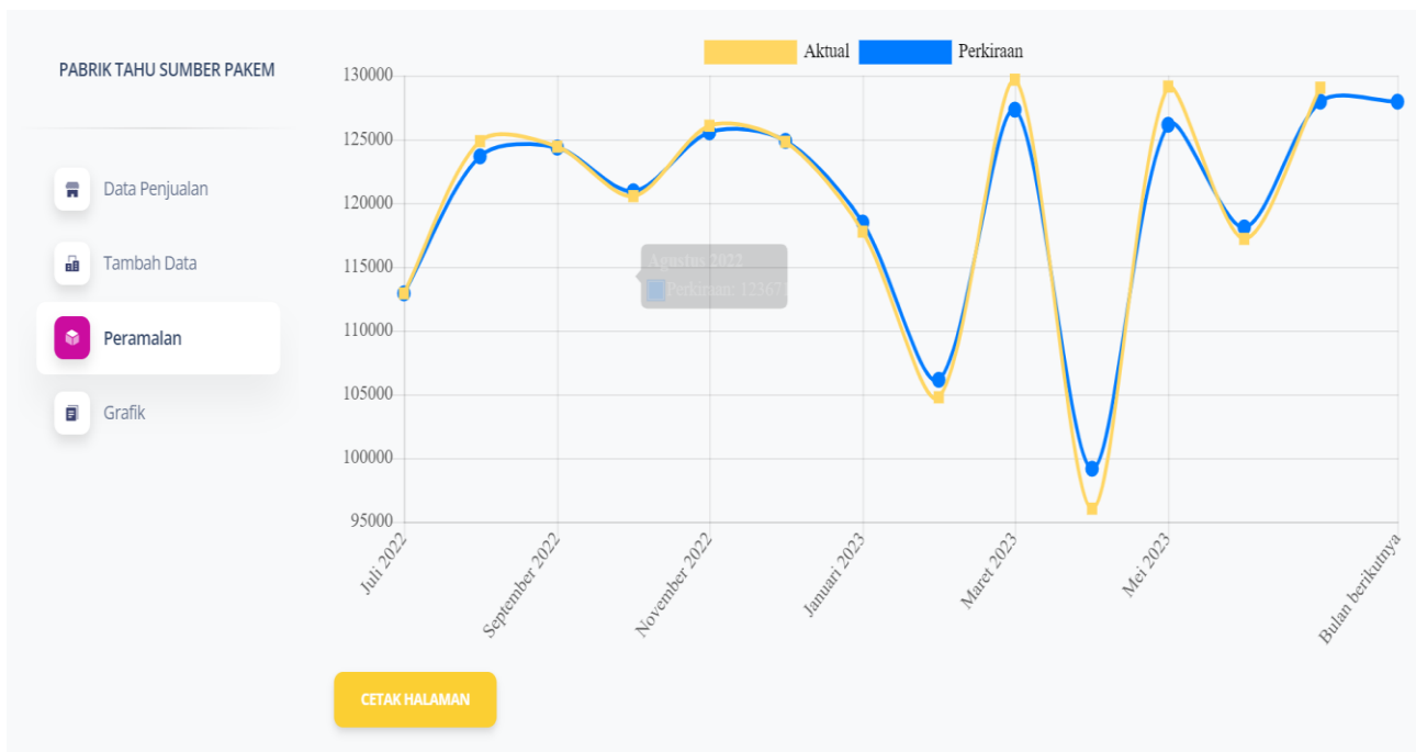
Gambar 3. Grafik peramalan menggunakan alpha 0,9

Grafik pada Gambar 3 tersebut memuat data aktual serta data hasil peramalan yang dihasilkan menggunakan alpha 0,9.