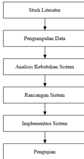
Gambar 1. Tahapan Penelitian

Gambar 1 berikut ini menunjukkan tahapan pada penelitian ini.