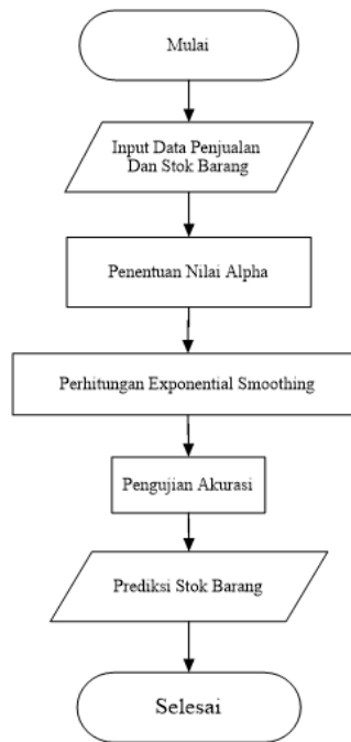
Gambar 3. Flowchart Sistem Single Exponential Smoothing