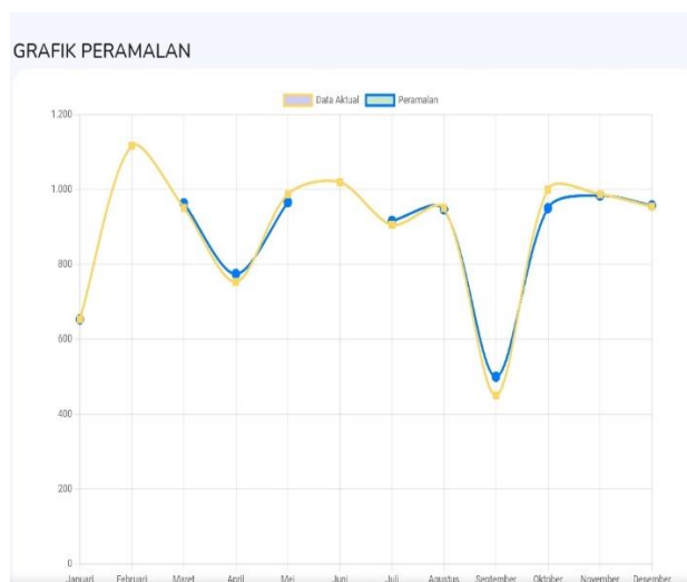
Gambar 4. Grafik peramalan

Mean Absolute Percentage Error (MAPE) menghitung kesalahan absolut untuk setiap periode dan membaginya dengan nilai observasi aktual untuk periode tersebut. Kemudian rata-ratakan persentase kesalahan absolutnya. Pada tahap pengujian terlihat bahwa metode Single Exponential Smoothing memerlukan perbandingan untuk menentukan nilai alpha terendah. Oleh karena itu, hasil alpha terendah dari perhitungan diatas adalah alpha 0,9 dan hasil MAPE sebesar 2,379% dan perkiraan penjualan selanjutnya adalah 905. Hasil dari proses peramalan tersebut ditunjukkan pada grafik yang ada pada system , di grafik terdapat hasil dari beberapa data aktual dan data peramalan dengan menggunakan alpha 0,9.