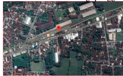
Gambar 1. Lokasi Penelitian Tugas Akhir

Dengan pelayanan yang baik, diharapkan jasa transportasi ini dapat memberikan kelancaran, kenyamanan dan keamanan bagi pengguna jasa.