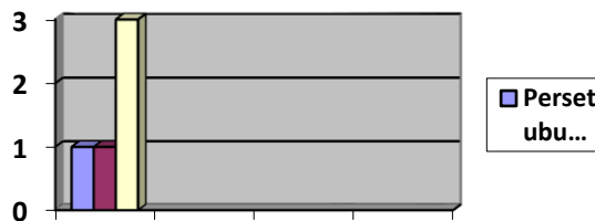
Gambar 6.4.2 Grafik Kasus Tindak Pidana Yang Menyebabkan Anak Sebagai Korban

Pada grafik diatas kasus yang terjadi pada tahun 2013 adalah kasus penganiayaan sebanyak (tiga) kasus, sehingga dapat disimpulkan bahwa tindak pidana penganiayaan yang paling banyak dilakukan.