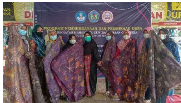
Gambar 3. Proses pembuatan batik ecoprint