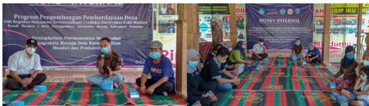
Gambar 7. Monev internal yang dihadiri oleh Wakil Rektor III dan Kepala Desa Karangpatihan

Pelaporan dilakukan sebagai bentuk pertanggungjawaban program. Pelaporan dilakukan setiap pelaksanaan program dan akan dilakukan pelaporan akhir sebagai gabungan dari pelaporan-pelaporan setiap program yang sudah dilaksanakan.