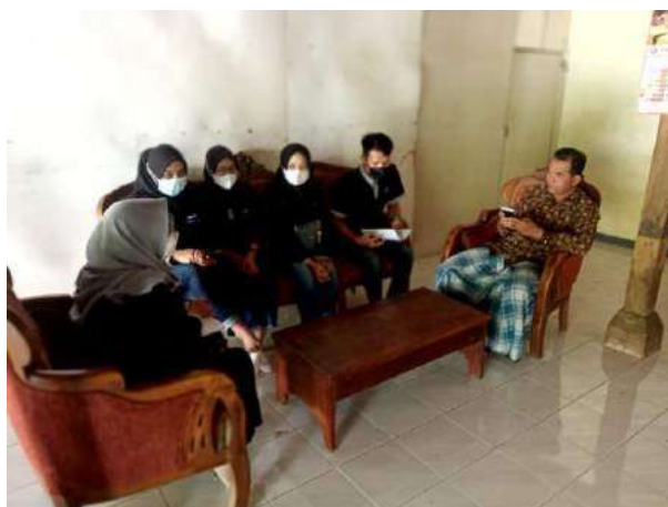
Gambar 1. Sosialisasi dengan pihak rumah harapan

Sosialisai yang dilakukan oleh Tim P3D Universitas PGRI Madiun yaitu dengan melakukan musyawarah dengan masyarakat, pendamping tunagrahita, pengurus rumah harapan, ibu-ibu PKK, dan pemerintah desa yang sangat mendukung kegiatan yang kami lakukan. Melakukan evaluasi dari program PHP2D dengan memberikan pelatihan guna menciptakan dan mengembangkan produk yang telah kami lakukan sebelumnya. Terdapat 5 program yang kami terapkan dalam P3D, yaitu: Perluasan pasar produk berbahan stocking, penambahan kelompok sasaran, diversifikasi produk, perluasan mitra, serta desa wisata. Dari hasil diskusi tersebut, maka terbentuk beberapa inovasi produk yang diharapkan dapat menarik daya beli konsumen.