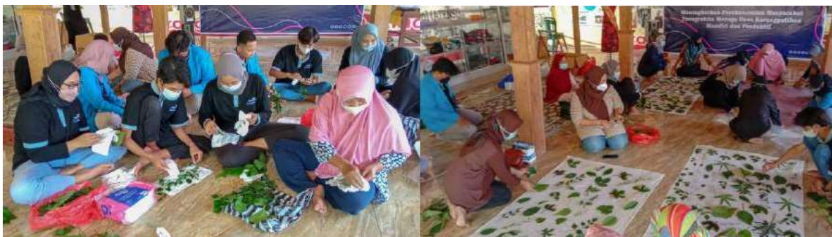
Gambar 2. Proses pembuatan batik ecoprint