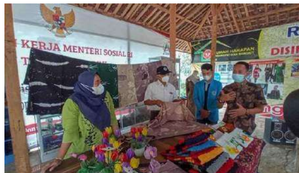
Gambar 5. Mitra dari Pemerintah desa dan Kabupaten, Universitas PGRI Madiun.

Dalam pelaksanaan program kami akan mengundang beberapa mitra yaitu Pemerintah desa dan Kabupaten, Kampus Universitas PGRI Madiun, mitra dari industri dan BUMN. Adanya beberapa mitra yang terlibat dalam program P3D ini diharapkan program lebih holistik dan mempunyai outcome yang lebih luas dan baik. Dari segi pembinaan terhadap masyarakat sasaran peran rumah harapan sangat besar sehingga kami akan selalu berkoordinasi dengan rumah harapan terkait program yang akan dilakukan.