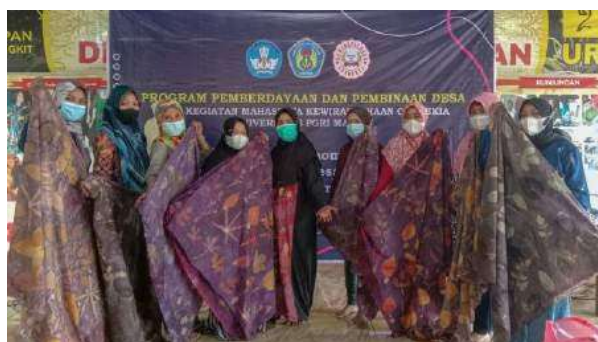
Gambar 3. Proses pembuatan batik ecoprint