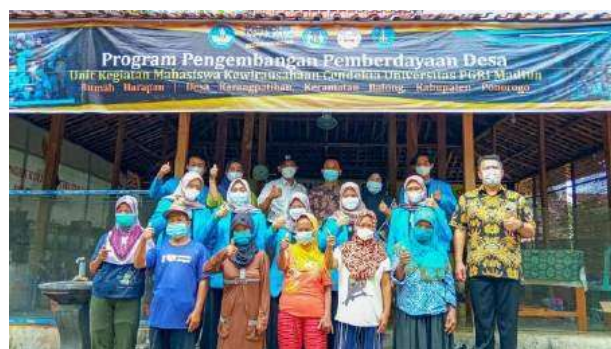
Gambar 6. Lokakarya hasil atau desiminasi yang dihadiri oleh pihak Biro Kemahasiswaan(BK m ) Universitas PGRI Madiun

Lokakarya hasil atau desiminasi dilakukan secara intern dan ekstern. Secara intern desiminasi kampus dengan audience dari semua perwakilan orgamawa yang ada di Universitas PGRI Madiun dibawah koordinasi dari Biro Kemahasiswaan (BKM). Secara Ekstern dilakukan dalam seminar nasional pengabdian masyarakat dan desiminasi juga dilakukan kepada belmawa kemendikbud.