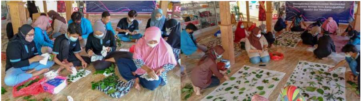
Gambar 2. Proses pembuatan batik ecoprint