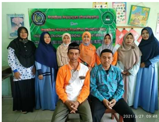
Gambar 4. Foto Bersama Setelah Kegiatan Pelatihan Selesai

Hasil pelatihan, evaluasi dan monitoring yang berupa laporan pelaksanaan kegiatan pengabdian kepada masyarakat yaitu pelatihan penyusunan proposal penelitian tindakan kelas akan diserahkan kepada Lembaga Penelitian dan Pengabdian Masyarakat Universitas Muhammadiyah Jember dan MIS Miftahul Ulum Kranjingan Jember. Laporan pelaksanaan kegiatan pengabdian kepada masyarakat ini merupakan dokumen hasil pelaksanaan program kegiatan pengabdian masyarakat yang didanai oleh Lembaga Penelitian dan Pengabdian Masyarakat (LPPM) Universitas Muhammadiyah Jember yang merupakan kontribusi lembaga untuk membantu memecahkan masalah yang ada di masyarakat sesuai dengan bidang ilmu dan keahlian semua pelaksana.