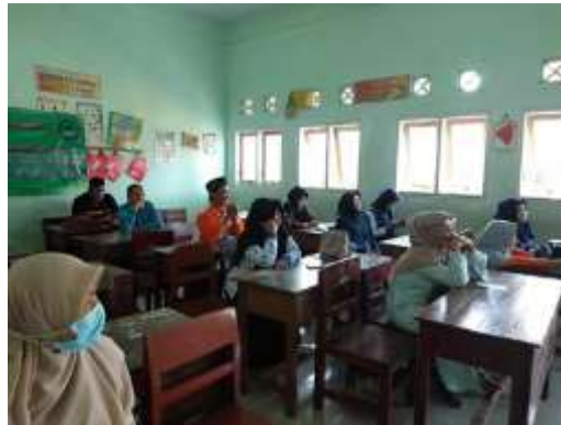
Gambar 2. Penyampaian Materi Penelitian Tindakan Kelas

siklus pertama sudah memenuhi kriteria ketuntasan penelitian sehingga siklus yang kedua merupakan uji konsistensi keberhasilan dari tindakan yang dilakukan dalam siklus sebelumnya. Jika dalam satu siklus kriteria keberhasilan yang sudah ditetapkan belum tercapai maka siklus kedua harus dilakukan dengan memperbaiki perencanaan pada siklus pertama. Dengan kata lain, siklus dalam penelitian tindakan kelas akan berulang-ulang sampai kriteria ketuntasan/keberhasilan yang sudah ditetapkan bisa tercapai.