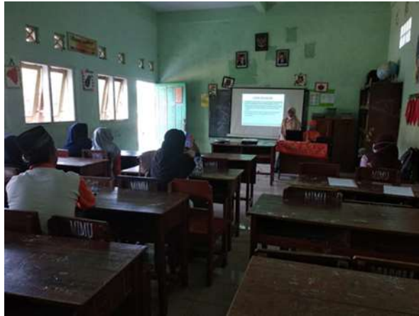
Gambar 3. Penyampaian Materi Penyusunan Proposal Penelitian Tindakan Kelas

lamporan yang harus disusun oleh personalia penelitian. Daftar Pustaka merupakan daftar rujukan yang dipakai dalam penulisan proposal penelitian. Lampiran merupakan hal-hal penting yang menjadi bagian dalam proposal penelitian seperti peta lokasi, kondisi sekolah, tabel rencana anggaran, tabel jadwal pelaksanaan dan alokasi waktu dan sebagainya.