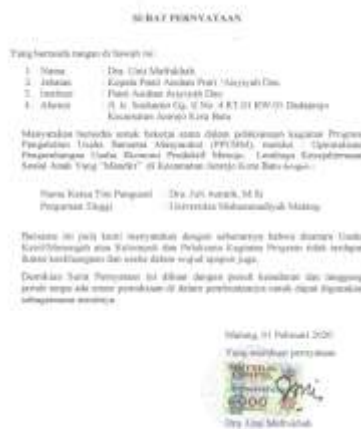
Gambar 1. Bukti Dokumen Surat Pernyataan Mitra

Dalam kegiatan awal ini dilakukan dengan penandatanganan surat pernyataan dari mitra yang menyatakan bersedia bekerjasama dalam pelaksanaan kegiatan program pengabdian ini. Kegiatan awal ini pada dasarnya merupakan kunci pembuka untuk keberlangsungan kegiatan pengabdian ini. Dengan adanya surat pernyataan kesediaan mitra untuk melakukan kerjasama membuktikan bahwa secara syah dan legal tim pengabdian dari Universitas Muhamamdiyah ini telah mengimplementasikan program kegiatan pengabdian ini bersama mitra. Bukti dokumen surat pernyataan mitra dapat dilihat pada dokumen di bawah ini ;