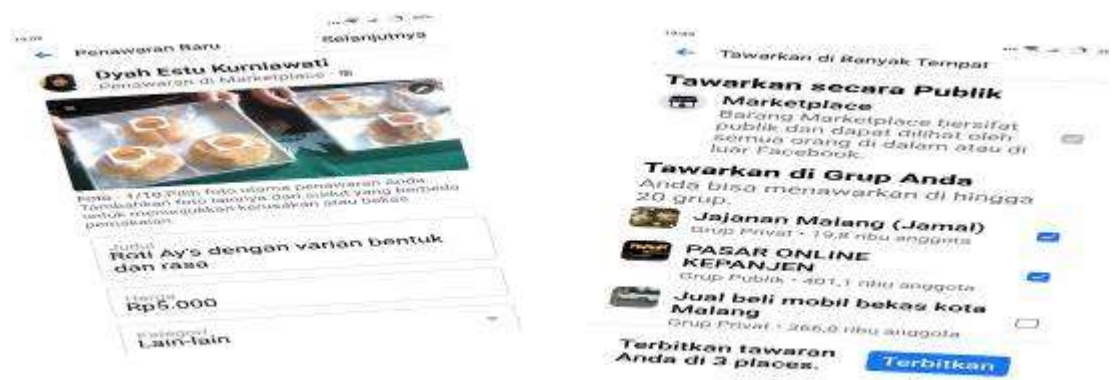
Gambar 5. Pelatihan pemasaran by online .

Kegiatan pelatihan ini disampaikan oleh anggota tim (Ibu Dyah Estu Kurniawati), dengan materi intinya adalah Pelatihan Pemasaran (membuat konten pada aplikasi market place ). Aktivitas program berkaitan dengan pelatihan dan pendampingan pemasaran produksi “Roti” dapat dilihat dalam dokumen kegiatan di bawah ini;