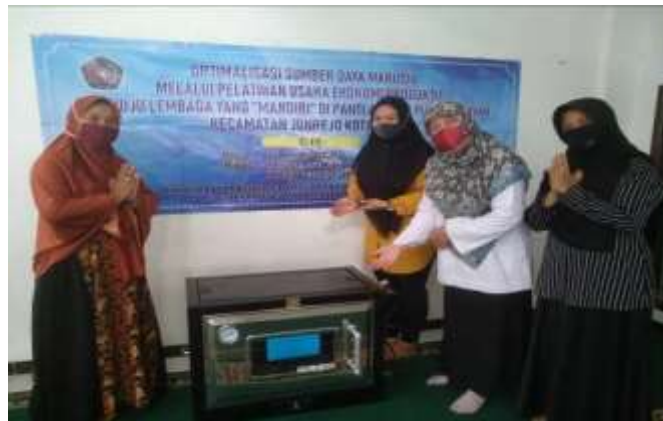
Gambar 6. Hibah barang Oven Gas dengan type 8044, Loyang berjumlah 6 biji dan timbangan kue dan spatula plastik.

Bantuan barang yang diberikan merupakan konsekuensi logis dari program kegiatan pengabdian ini, karena pengabdian ini berorientasi pada pembuatan roti dengan aneka rasa dan varian, maka berupa : 1) Oven Gas dengan type 8044 satu pintu yang merupakan peralatan vital dalam proses pembuatan roti, 2) loyang sebagai tambahan jika produksinya dalam jumlah besar, sekaligus loyang tersebut juga dipergunakan mitra sebagai tempat meletakkan adonan yang sudah siap untuk dioven dan 3) Timbangan kue, yang dipergunakan untuk mengukur/menimbang bahan-bahan yang diperlukan sesuai dengan ukuran yang sudah ditetapkan dalam resep. 4) Peralatan lainnya seperti : baskom plastik, spatula dari bahan plastic maupun kayu, dan 5) taplak plastik yang dipergunakan sebagai alas untuk membentuk adonan menjadi berbagai varian bentuk. 6). Pemberian barang berupa Masker kain, karena pengabdian ini dilakukan dimasa pandemo covid, maka untuk menjaga higienitas dan kesehatan peserta pelatihan, tim memberikan masker untuk semua anak-anak di Panti Asuhan tersebut masing-masing anak menerima 2 buah masker katun anti virus dan bau dengan merk "MASKA". Lebih jelasnya dalam pelaksanaan kegiatan pemberian bantuan barang dapat dilihat pada dokumen di bawah ini :