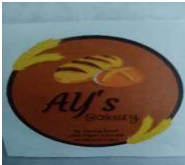
Gambar 3. Gambar plastik pembungkus roti yang sudah bermerk dagang AY's

Kegiatan pembuatan desain merk dimaksudkan untuk memberikan hak merk dagang yang dapat memberikan identifikasi secara spesifik dari hasil usaha yang dimiliki oleh Panti tersebut. Berdasarkan kesepakatan antar anggota mitra dibuatlah desain merk dagang roti hasil usaha Panti 'Aisyiyah ini dengan merk "AY's yang merupakan singkatan dari 'Aisyiyah. Logo merk dagang dapat dilihat pada gambar di bawah ini :