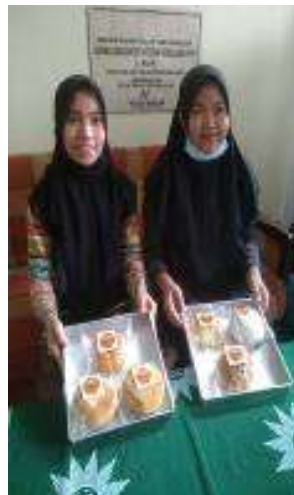
Gambar 4. Suasana pengemasan hasil produksi roti dengan aneka rasa dan varian”