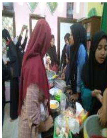
Gambar 2. Suasana pelatihan dalam pembuatan roti

Kegiatan ini dilakukan pada tanggal 11 Oktober 2020 bertempat di Panti Asuhan Putri ‘Aisyiyah Dau dengan menghadirkan seorang ahli pembuat roti. Pelatihan dan pendampingan pembuatan “Roti” dengan berbagai varian dan rasa ini diikuti dengan semangat dan antusias dari peserta. Aktivitas program berkaitan dengan pelatihan produksi “Roti” dapat dilihat dalam dokumen kegiatan di bawah ini;