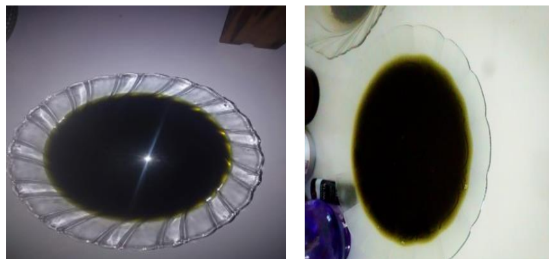
Gambar 1. Ekstrak Daun Gewang

Metode yang digunakan dalam pembuatan ekstrak adalah metode maserasi. Prinsip maserasi adalah cairan penyari akan menembus dinding sel, zat aktif akan terlarut karena adanya perbedaan konsentrasi antara larutan zat aktif di dalam sel dan di luar sel, sehingga larutan dengan konsentrasi tinggi akan terdesak ke luar sel. Simplisia yang digunakan adalah daun muda karena daun muda lebih efektif untuk larut dalam etanol. Serbuk simplisia daun gewang yang sudah dikeringkan, kemudian direndam dengan etanol 70% sebanyak 1000 mL selama 24 jam. Hasil maserasi berupa filtrate berwarna hijau tua (hijau agak kehitaman) seperti tampak pada Gambar 1. Ekstrak disaring dan kemudian dipekatkan menggunakan rotary evaporator dengan pompa vakum pada suhu 70°C untuk memisahkan ekstrak kental dan etanol. Ekstrak kental yang diperoleh sebanyak 1,85 gram dan rendemen yang dihasilkan adalah 0,94 %.